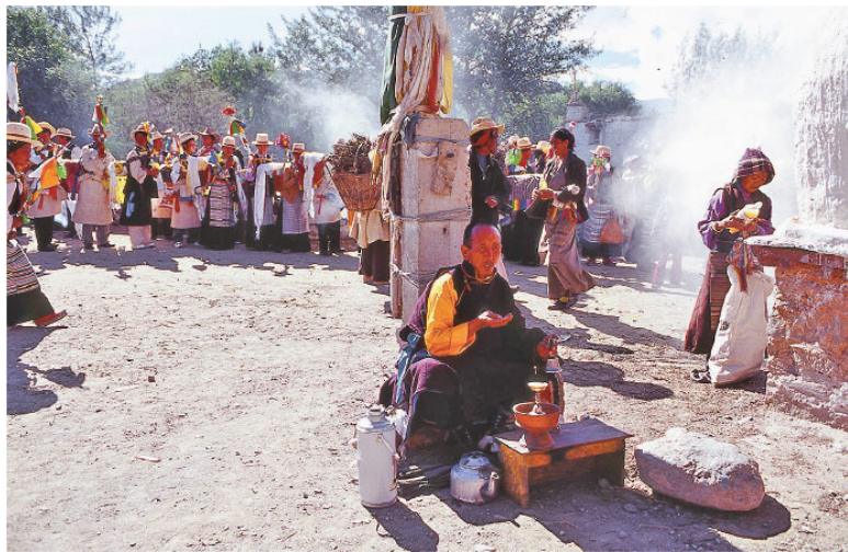
Колдун за работой

го буддизма было относительно слабым, сегодня сохранились некоторые магические религиозные практики, такие как баймо в районе Байма и патцу в районе Мяннин. Наследование и иерархия служителей культа в этих практиках происходит главным образом от божественных прав, дарованных во сне, и в малой степени – от отца к сыну или от мастера к ученику. У них есть свои заклинания, молитвы и жертвоприношения.