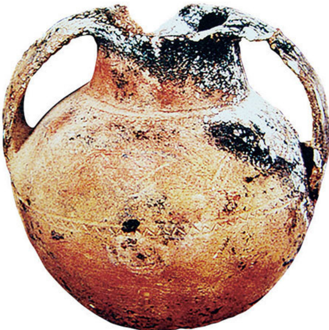
Глиняный кувшин с двумя ручками, найденный при раскопках в Цюйгуне

Тибетские легенды и древние книги дают возможность связать происхождение предков здешних жителей с древними обитателями Цинхай-Тибетского нагорья.