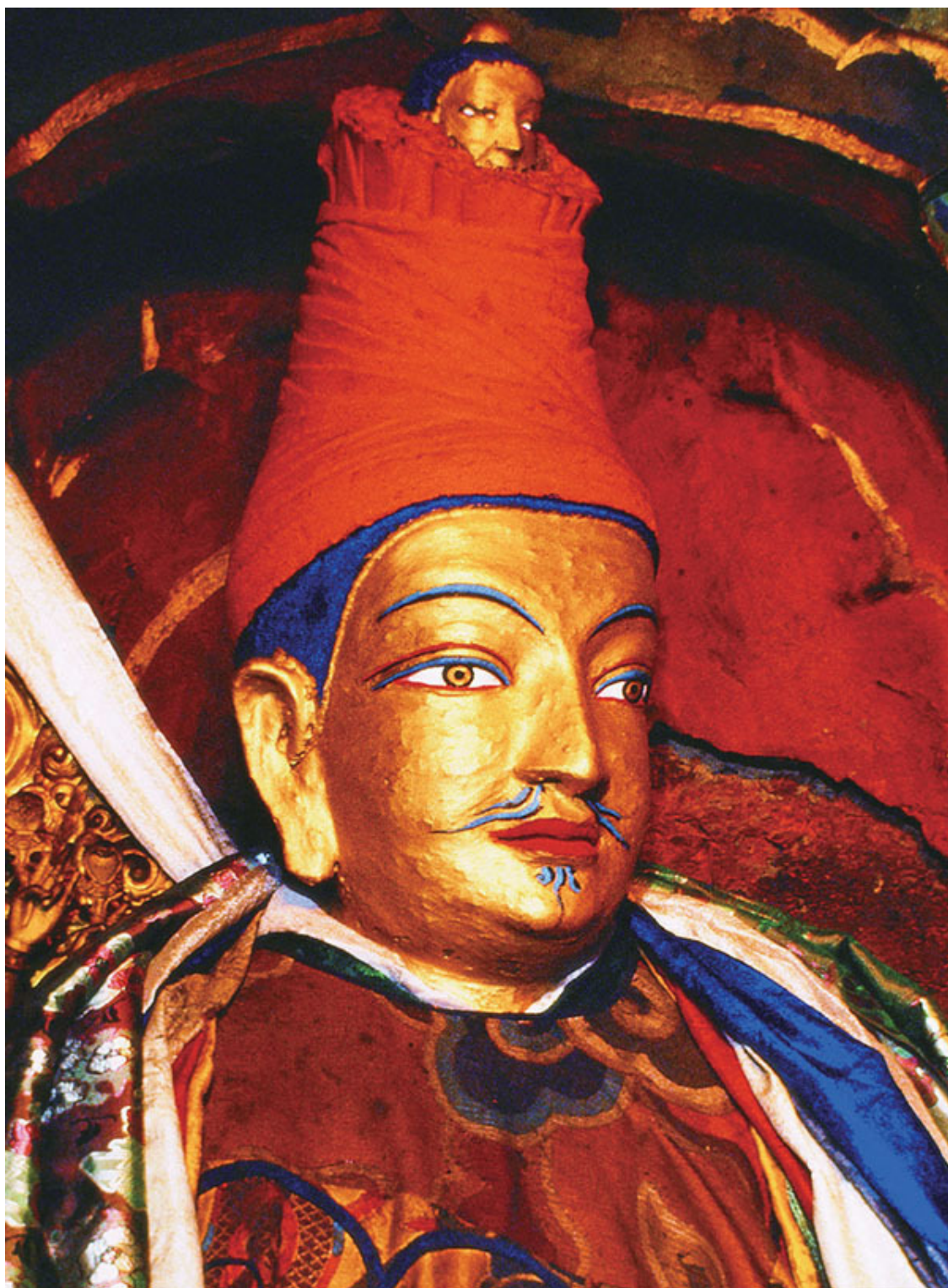
Статуя Сонгцена Гампо

Его основной задачей в тот период было подавление повстанческих настроений и вторжение в несколько оставшихся автономными государств, таких как Сумпа и Чжангжунг. Ему также нужно было координировать отношения между старыми и новыми министрами, разрешать их конфликты, возникающие при распределении власти, укреплять позиции семьи Ценпо и консолидировать власть. В «Дуньхуанской летописи царства Тубо» есть сведения, что Намри Сонгцен послал войска для подавления мятежников Дагбо, за что повстанцы отравили его.