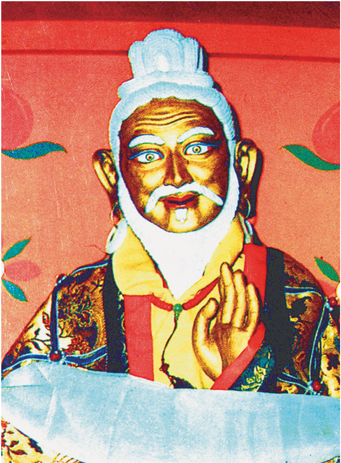
Статуя мастера тибетской медицины Ютока Йонтена

Прежде всего Сонгцен Гампо создал литературный тибетский язык и установил законы. Литературный язык был необходим для развития тибетского общества. В то время в ряде областей уже использовалось несколько языков. Вскоре после вступления на престол Сонгцен Гампо отправил представителей знати, таких как Тонми Самбхота, учиться лингвистике в Индию.