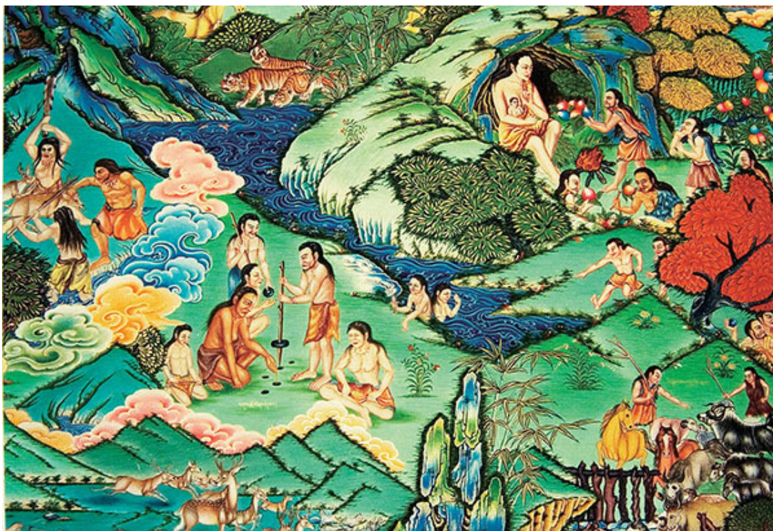
Сцена рыбной ловли и охоты в долине реки Ярлунг

Тубо. Впоследствии из этих кланов образовалось шесть народностей – дбра , вгрюи , лдон , лгаб , дбаз и брдав – и от каждой из них еще с десятков ответвлений. Фамилия по-тибетски – русна , что означает «кость». Это указывает на тесную связь между фамилией и родством. Древние племена разделялись по мере развития производства и увеличения численности людей. Несколько племен могли объединиться в одно путем межплеменных браков, союзов, войн и т. п.