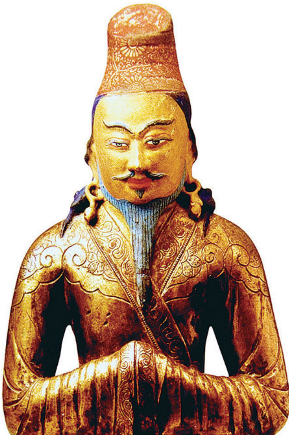
Министр Тар Тонгцен