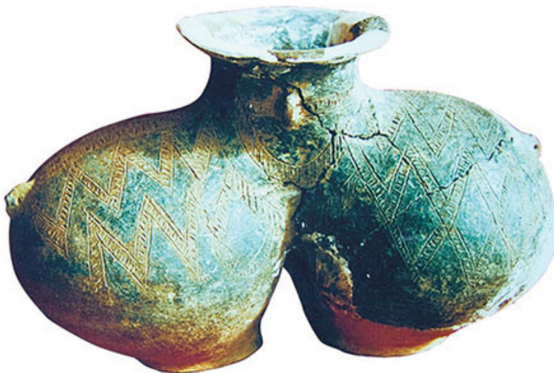
Фаянсовая керамика, найденная в руинах близ Каруба

Кроме того, были обнаружены кости более 10 видов животных (таких, как свинья, антилопа и сибирская косуля), запасы пшена, а также 27 каменных жилищ с печами и погребями. Археологи считают, что постройки в Карубе могли быть сделаны 4 тыс. лет назад, и это служит доказательством того, что человек в Тибете стал вести оседлый образ жизни, а его производственная деятельность расширилась от охоты до сельского хозяйства. Считается, что эта примитивная деревня просуществовала не менее тысячи лет и имела такой же уровень развития культуры, как Мацзяяо, Бань-Шань и Мачан вдоль Желтой реки 1 . В развалинах района Цюйгун в Лхасе были найдены две древние каменные гробницы и почти 10 тыс. каменных орудий. Найденные там костяные инструменты – в основном буравчики и иглы. Особенность игл состоит в том, что отверстие у них располагается на кончике, а не на ушке, как у иглы современной швейной машины. Это первая находка подобного рода. Керамические изделия включают кувшины с одной петлевой ручкой или двумя петлевыми ушками, а также пузатые кувшины с чашеобразным горлышком. Они покрыты глазурью и украшены разнообразными геометрическими рисунками. Кроме того, в раскопках были найдены каменные лопаты и ручные мельницы, свидетельствующие о наличии земледельческого хозяйства в Лхасе 4 тыс. лет назад 2 .