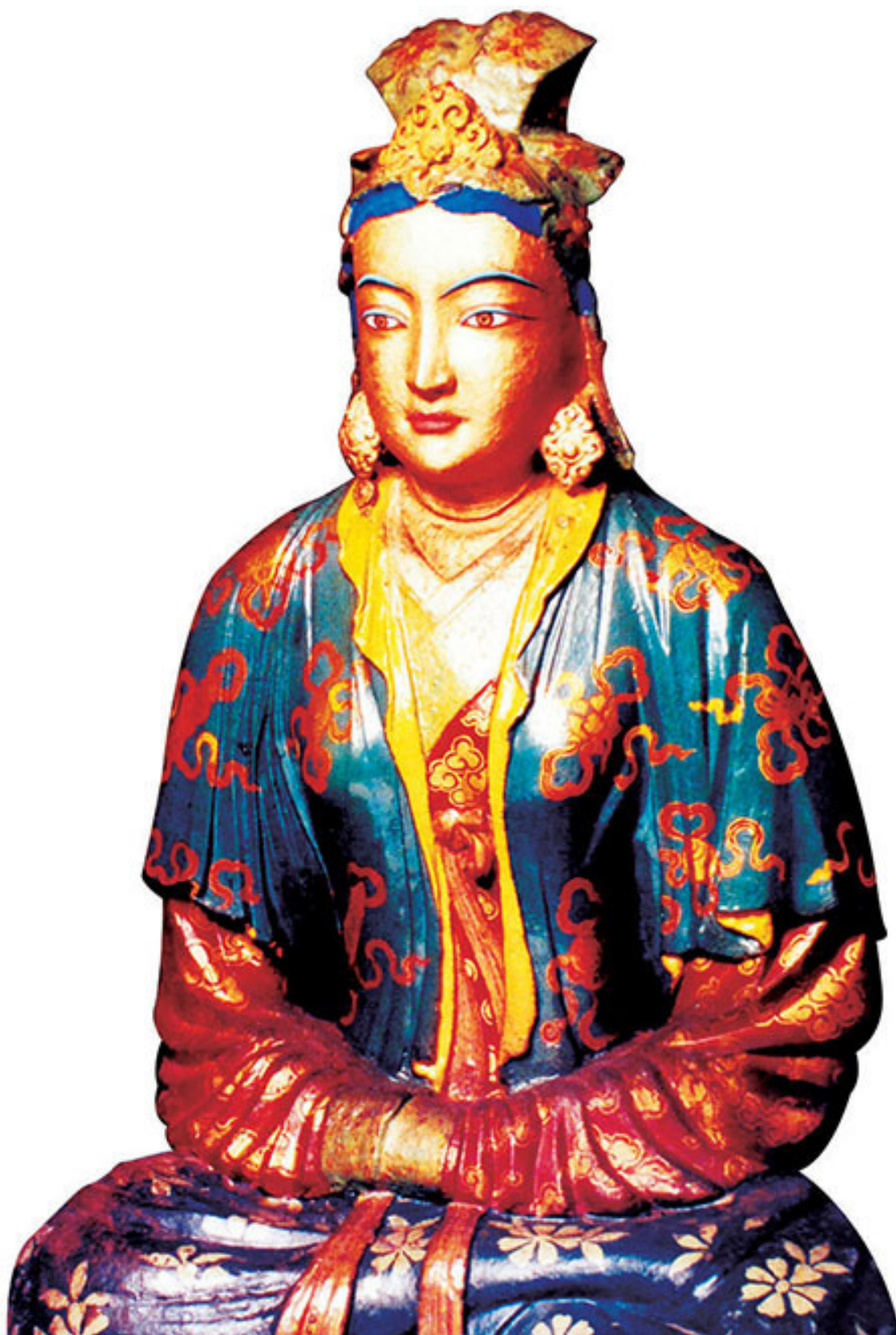
Статуя принцессы Вэньчэн во дворце Потала

Контролируя значительную часть Цинхай-Тибетского нагорья, Сонгцен Гампо активизировал экономические и культурные отношения с соседними странами. Министра Тара Тонгцена Юлсунга отправил в Непал, чтобы устроить брак между Ценпо и непальской принцес-