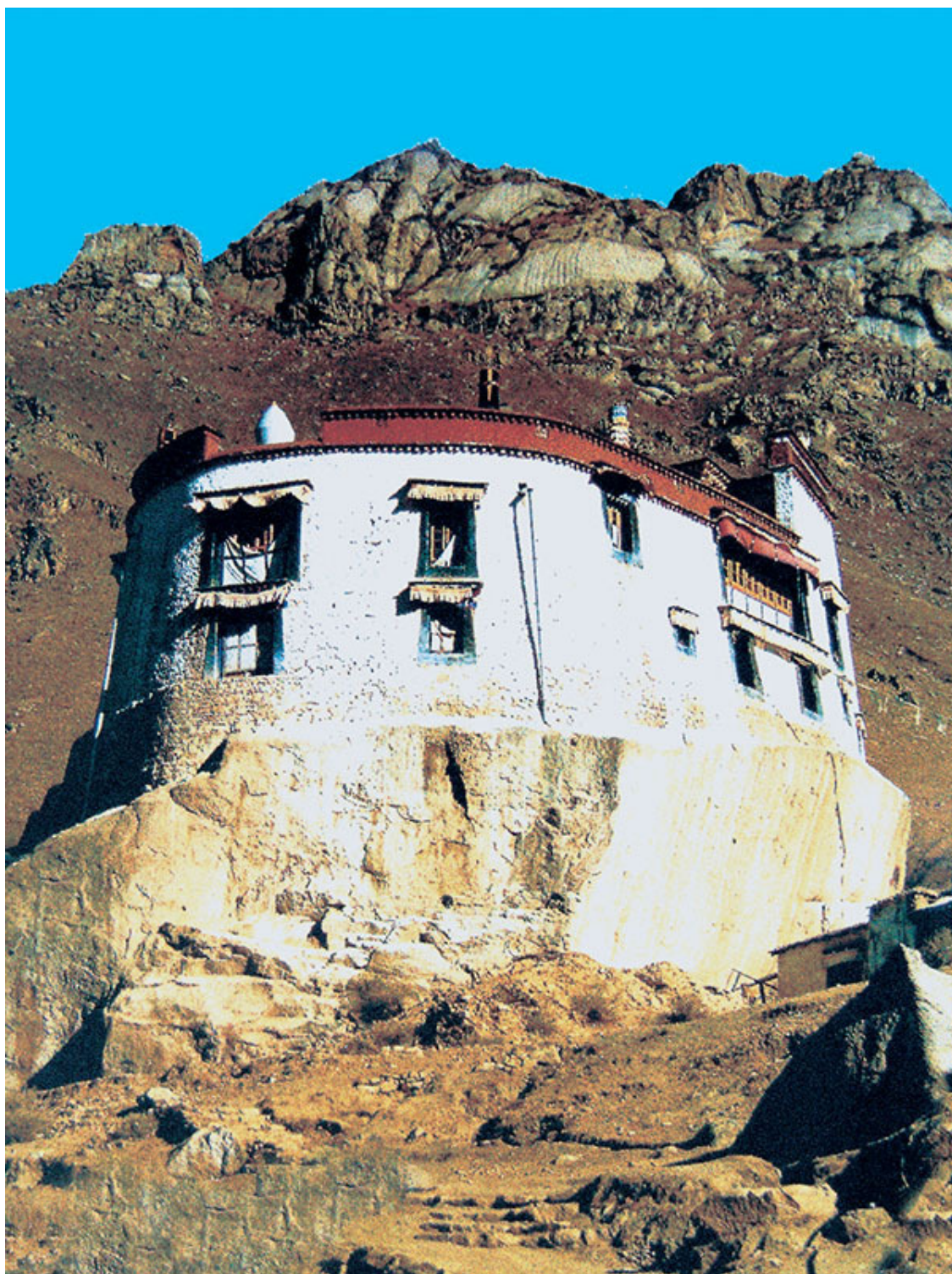
Паёнка, где была создана тибетская письменность

Позже, на основе полученных ими знаний, был создан тибетский алфавит, который сразу же начал применяться для управления делами в царстве Тубо. Ценпо с большим энтузиазмом пропагандировал использование тибетского алфавита, поднимая местную цивилизацию на новый уровень. Он также сформулировал ряд законов, призванных консолидировать власть в руках царской семьи и знати, регулировать поведение различных социальных классов и подавлять восстания. Непосредственными помощниками Ценпо в царстве Тубо были блон-чед