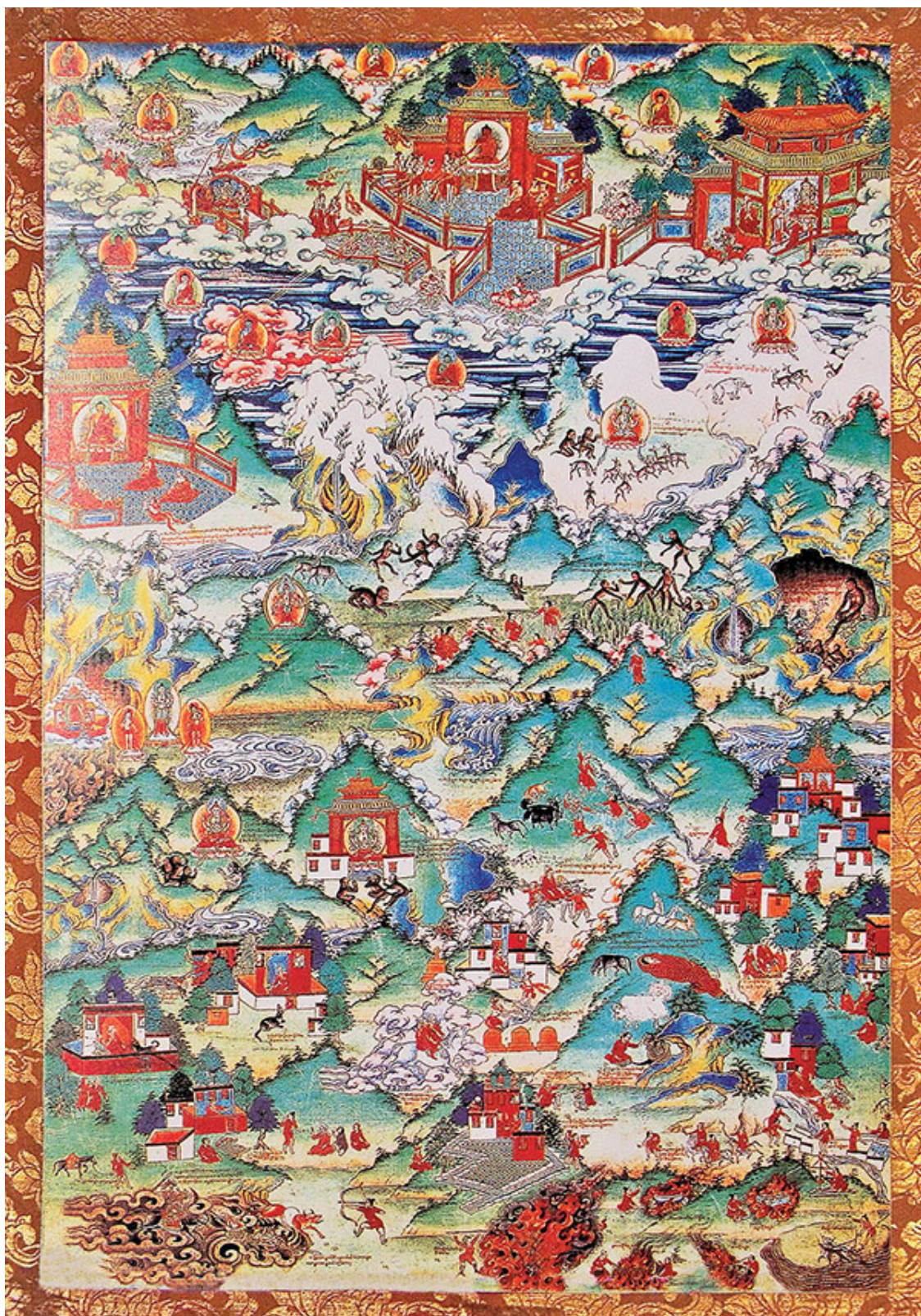
Тханка, на которой изображено происхождение тибетцев (из коллекции дворца Потала)

Подобно этническим группам на других территориях, предки тибетцев формировали кланы и племена в соответствии с кровным родством и в процессе эволюции перешли от матриархата к патриархату. В древней книге «Большой китайско-тибетский справочник» (Rgya Bod Yig Tshang) на тибетском языке сказано, что предки тибетцев первоначально были разделены на четыре клана: сё , рмю , стон и лдон . Их потомки составляли большинство жителей царства