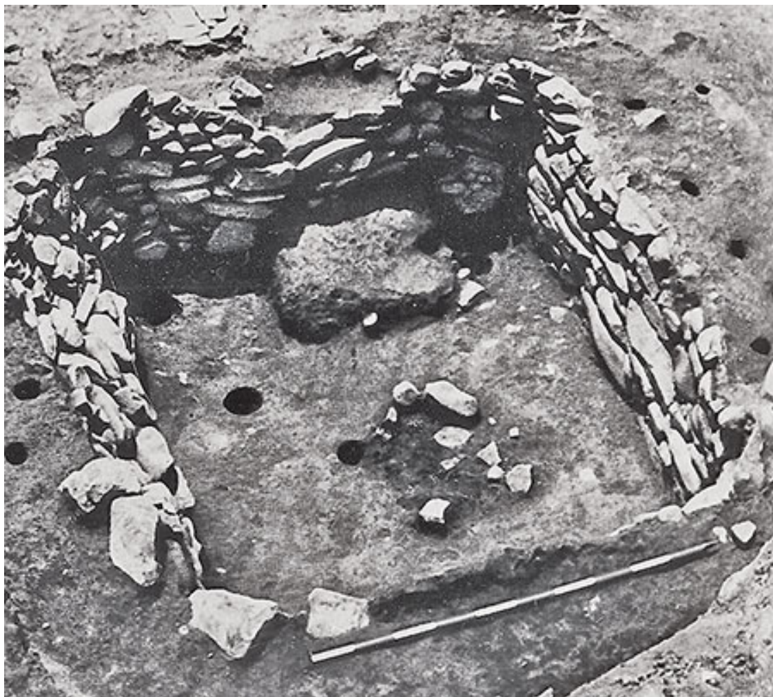
Жилые постройки в руинах близ Каруба

доказывают присутствие человека на Цинхай-Тибетском нагорье уже в древние времена. Особенно значительны раскопки руин районов Каруб в Чамдо и Цюйгун в северном пригороде Лхасы. На месте археологических изысканий в Карубе, занимающем площадь около 10 тыс. м 2 , было обнаружено около 7 тыс. остатков крупных каменных орудий (в том числе лопаты, топоры, мотыги, плуги, резцы, скребки и рубящие инструменты), более 400 костяных орудий (буравчики и иглы) и более 20 тыс. предметов четырехцветной керамики (кувшины, чаши и горшки).