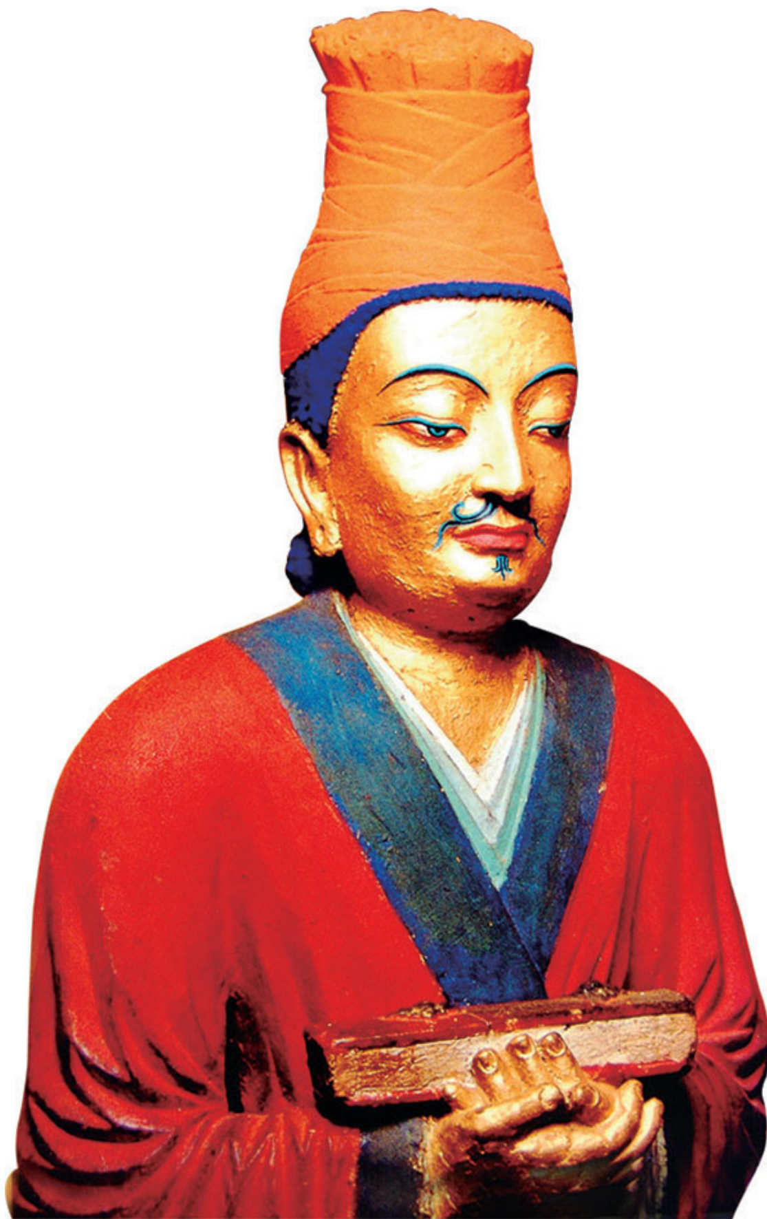
Статуя Тхонми Самбхоты