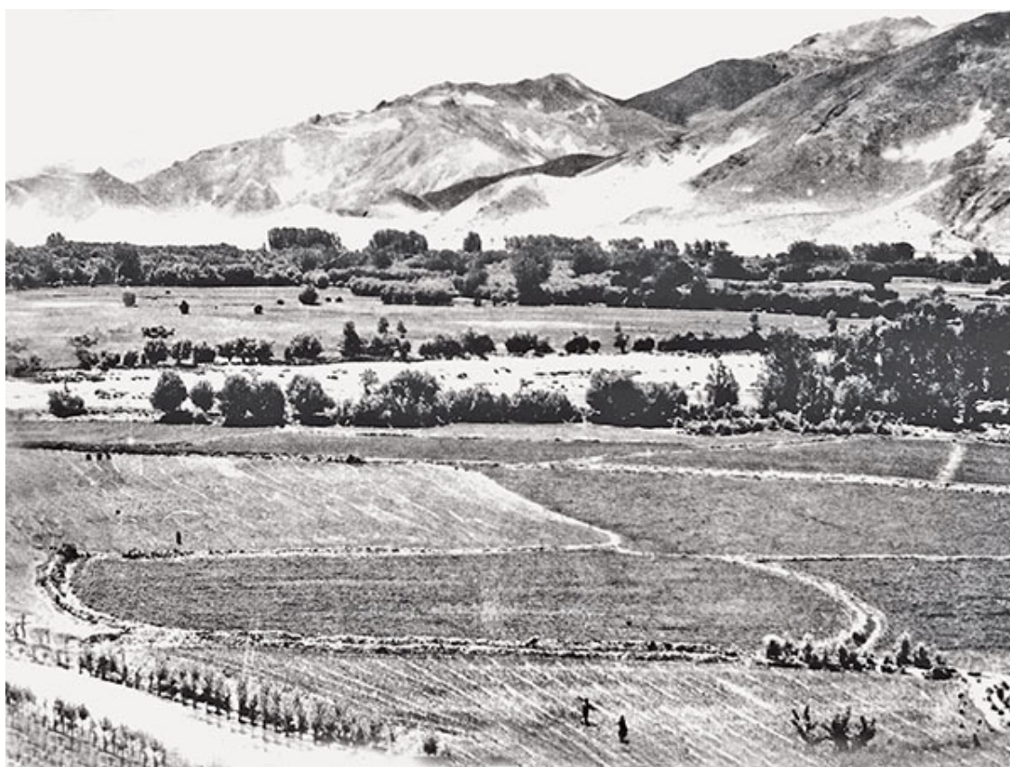
Говорят, что первая в Тибете ячменная ферма находится в деревне Сала в Цеданге

Начиная с 1950-х годов, в Тибете проводились археологические изыскания, были найдены древние памятники, в том числе палеолитического или неолитического периода. Они