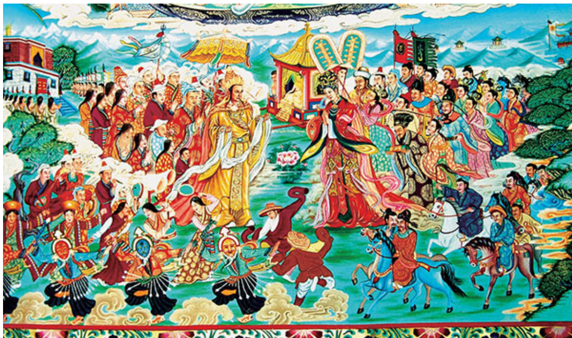
Свадебная церемония Сонгцена Гампо и принцессы Вэнъчэн (тханка)

В-третьих, Сонгцен Гампо стремился к объединению племен на Цинхай-Тибетском нагорье. После завоевания Чжангжунг и Сумпы царство Тубо начало экспансию на северо-восток. Царство Туюхунь, находившееся во власти этнической группы Сяньбэй, мигрировавшей из северо-восточного Китая, контролировало районы вокруг озера Цинхай. Большинство подданных царства Туюхунь были выходцами из племен Западного Цяна, они имели кровную связь с Тубо. Чтобы объединить Тангут и Западный Цян и открыть проход в экономически и культурно развитый район реки Хуанхэ, Сонгцен Гампо решил поглотить Туюхунь. Он направил туда солдат, Туюхунь, в свою очередь, обратился за помощью к династии Тан, что в итоге привело к военному конфликту между Тубо и империей Тан. Войска Сонгцена Гампо осадили пограничный город Сонгчжоу, но никто не одержал решающей победы. При таких обстоятельствах тибетский царь решил породниться с династией Тан путем династического брака.