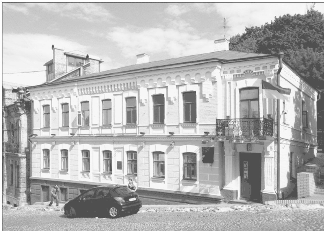
Дом № 13 по Андреевскому спуску.

у пышущей жаром изразцовой площади „Саардамский Плотник“, часы играли гавот, и всегда в конце декабря пахло хвоей, и разноцветный парафин горел на зеленых ветвях».