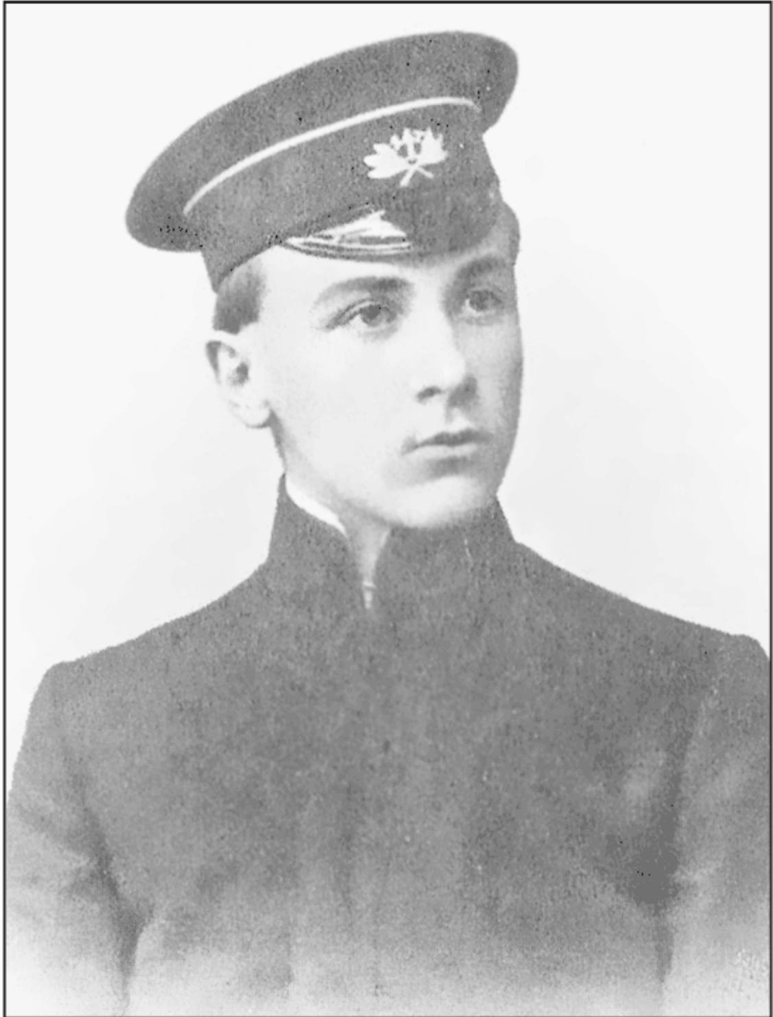
М. А. Булгаков в 1909 г.