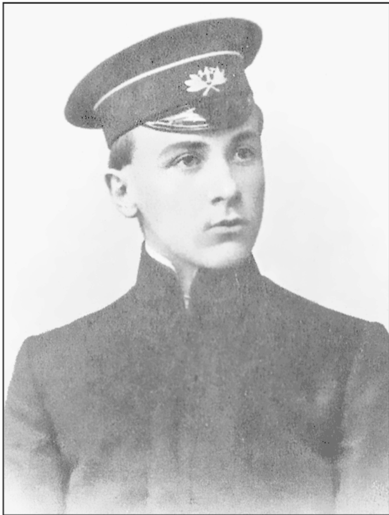
М. А. Булгаков в 1909 г.