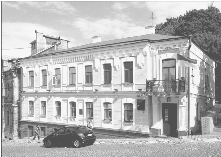
Дом № 13 по Андреевскому спуску.