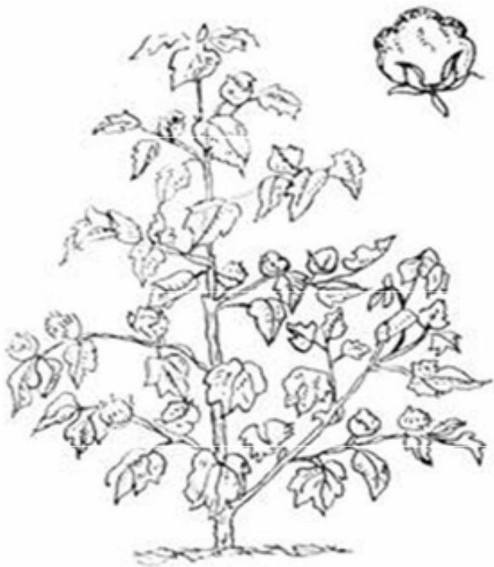
Рис. 1. Хлопчатник ( Gossypium )

Это однолетнее кустарниковое растение с крупными ли-