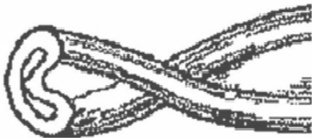
Рис. 2. Внешний вид хлопкового волокна нормальной зрелости

зрелости волокна. От степени зрелости зависят и свойства волокна. Незрелые волокна имеют вид сплюснутых ленточек с тонкими стенками и широким каналом, обладают малой прочностью, плохо окрашиваются и не пригодны для переработки. По мере созревания волокон отчетливо проявляются стенки, ограничивающие его канал. Волокно нормальной степени зрелости имеет вид штопорообразной извитой трубочки с развитыми стенками и внутренним каналом, замкнутым со стороны естественного конусообразного окончания волокна и открытого в месте прикрепления волокна к семени (рис. 2). У перезрелых волокон канал составляет его поперечник; извитость почти исчезает, они очень жесткие и ломкие [8].