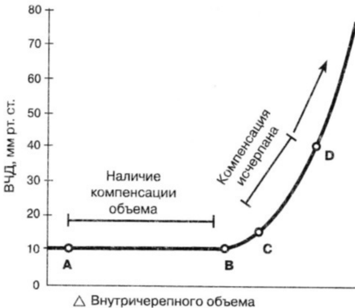
Рис. 3. Кривая объем-давление для головного мозга

Вазогенный отек. Наиболее часто встречающаяся форма отека головного мозга, характеризующаяся увеличением объема внеклеточной жидкости. Основной механизм формирования вазогенного отека – повышение проницаемости капилляров, вследствие нарушения функции гематоэнцефалического барьера. В зависимости от выраженности патологических изменений капилляров меняется состав отечной жидкости, которая представляет собой смесь плазмы крови, продуктов распада мозговой ткани и нормальной внекле-