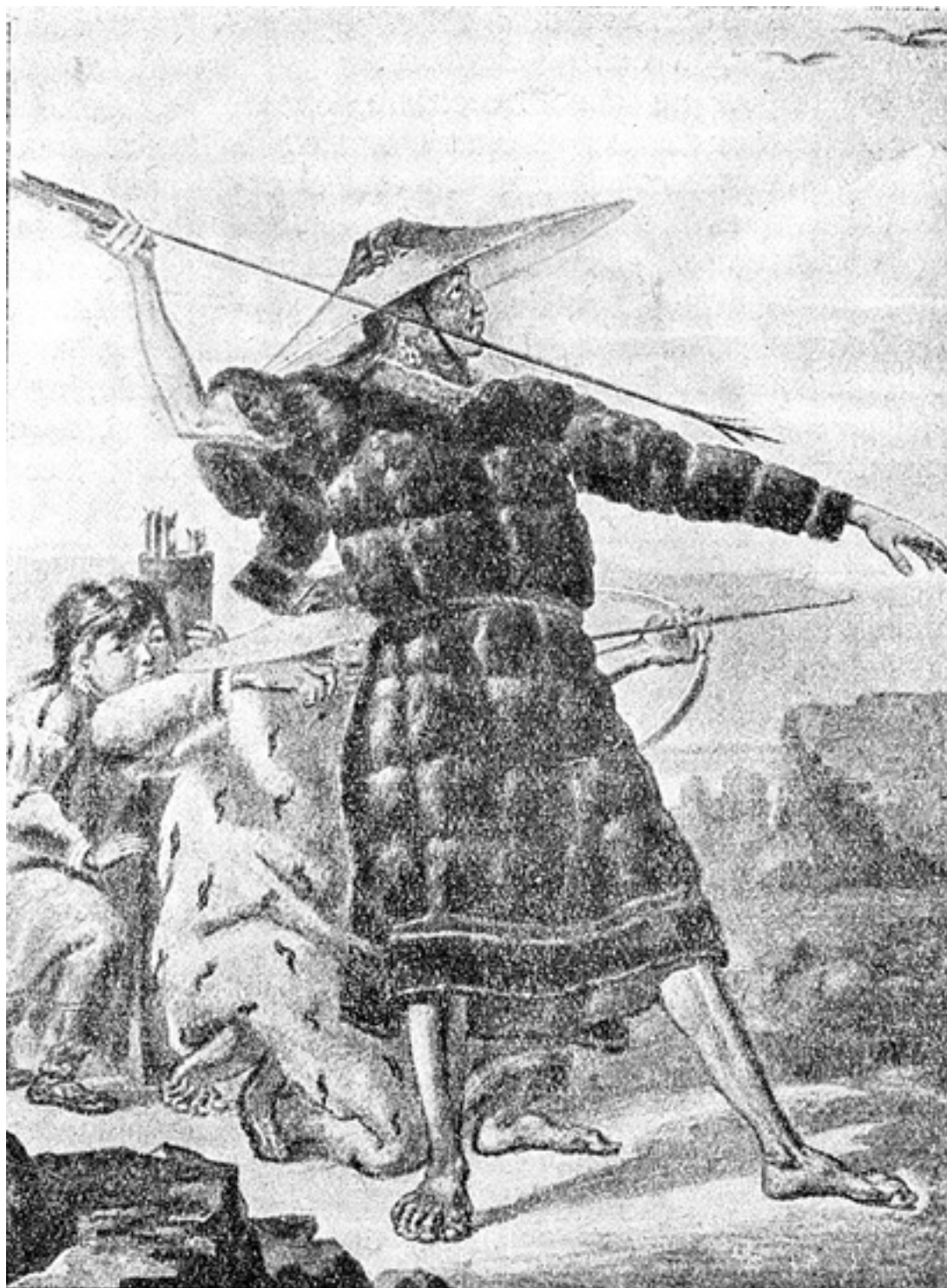
Рис. 8. Алеуты в традиционной одежде на охоте. Недатированный рисунок Михаила Тихонова

Эта цитата свидетельствует о том, что Екатерина II не отвергала заложничество как такое даже в конце XVIII века. С точки зрения императрицы и ее служилых людей, его нужно было только адаптировать к местным нуждам и «представить в нужном свете». Как будет показано далее, завоевание, эксплуатация и заселение островов в северной части Тихого океана, а также островов Русской Аляски в действительности протекали бы гораздо сложнее и сопровождалось бы гораздо большим количеством неудач, если бы не применялось заложничество как универсальное средство – будь то для сбора ясака , для гарантии выживания российских