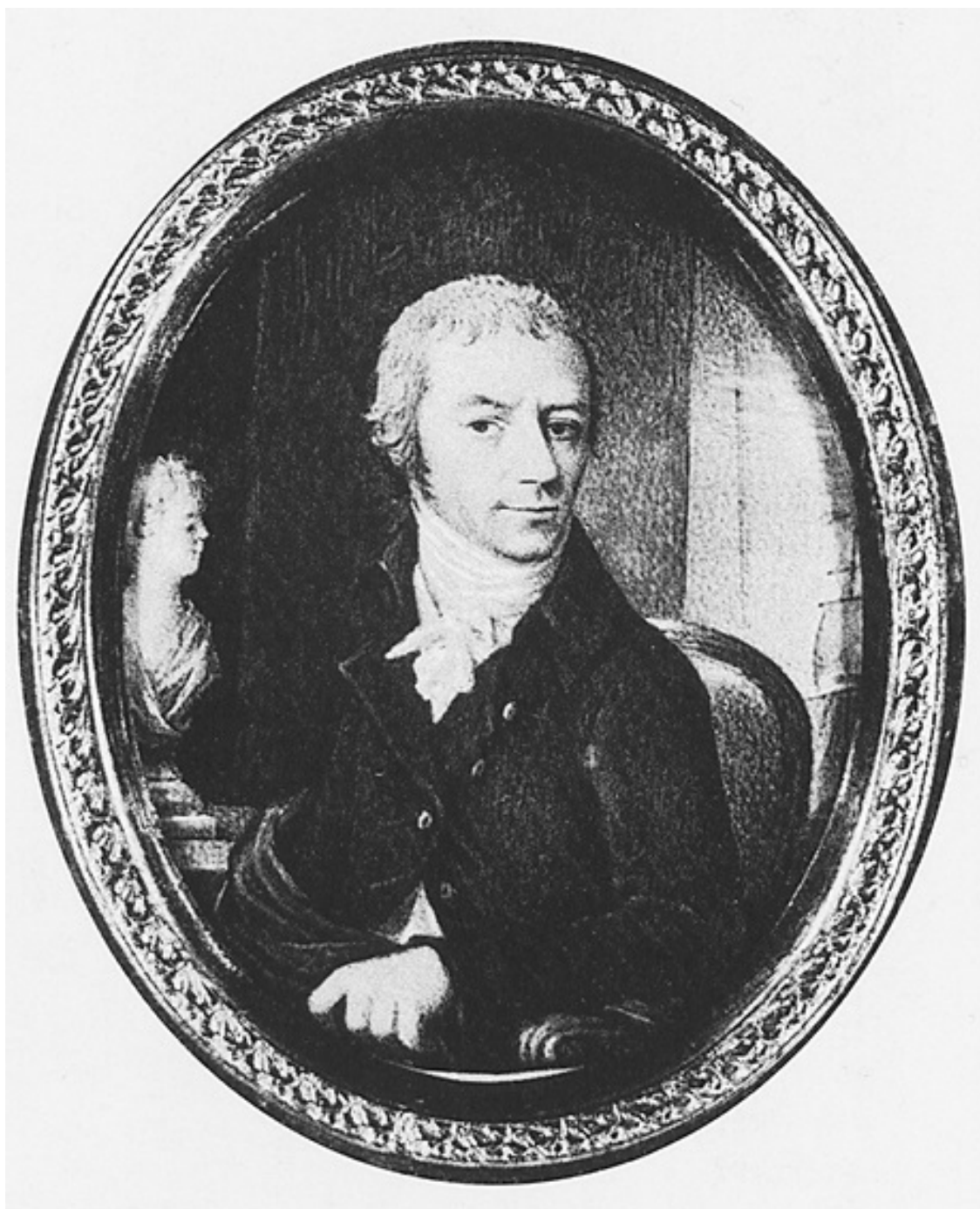
Рис. 10. Григорий Иванович Шелихов, русский купец, исследователь и завоеватель; на заднем плане – бюст его жены