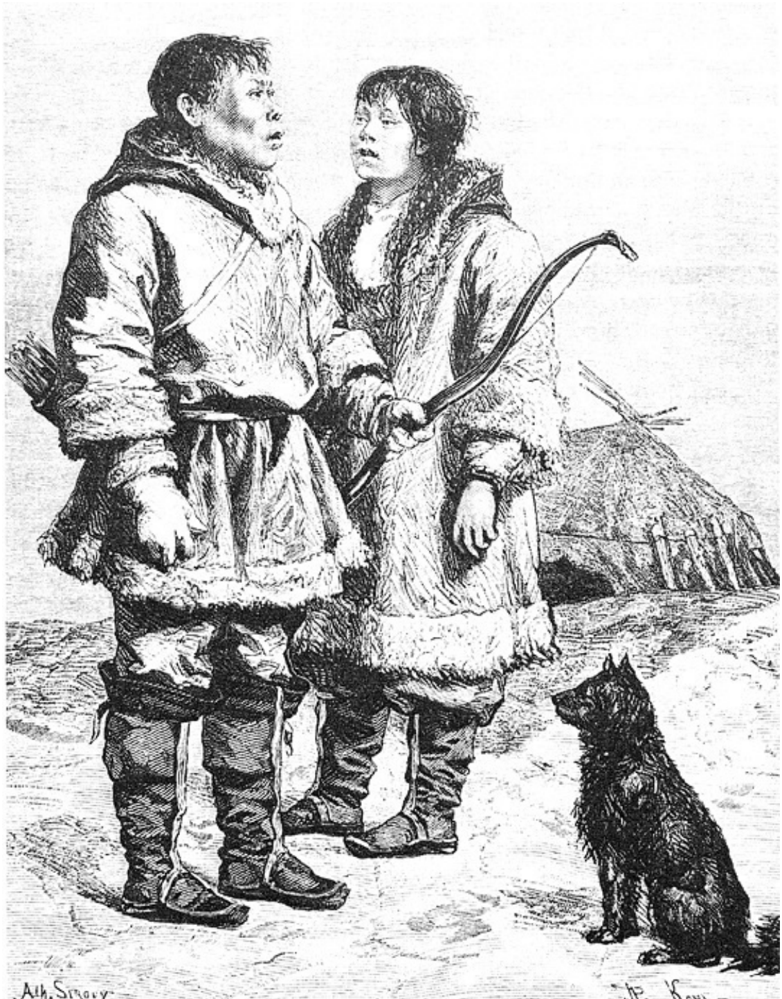
Рис. 3. Семья чукчей в кафтанах из оленьих шкур с собачьим или волчьим мехом. На заднем плане – яранга, большая палатка из оленьих и моржовых шкур. Рисунок XIX века

водило к «доброму духу» и приносило удачу родственникам 361 . Переход в царское заложничество ассоциировался со смертью. Таким образом, потерю тех, кто был успешно «похищен» российской стороной, можно было больше не принимать во внимание 362 .