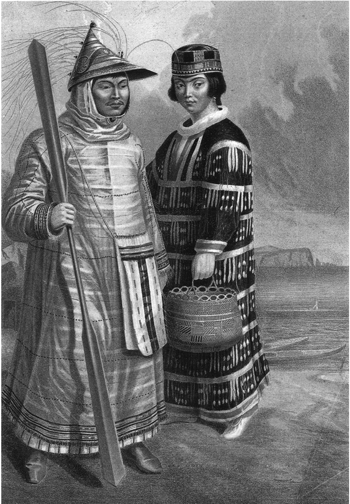
Рис. 11. Алеутская пара в традиционных костюмах перед своими лодками. Хромо- тография, художник неизвестен, впервые опубликована Густавом-Теодором Паули в: Народы России. Санкт-Петербург, 1862

Сомнительно, можно ли говорить о добровольности относительно почти пятисот детей, взятых в заложники, о том, насколько мирно протекала жизнь в школе и насколько были