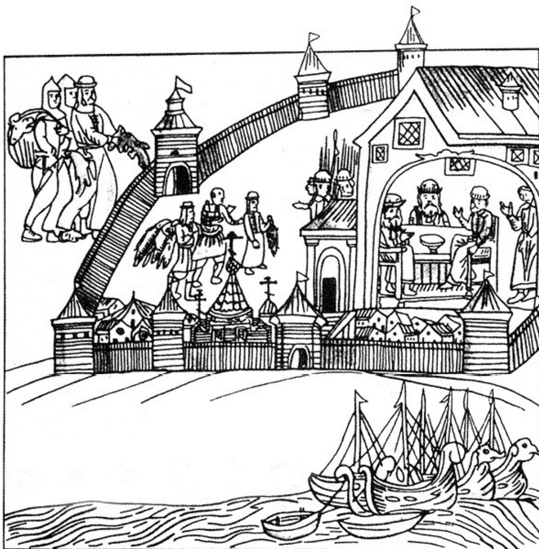
Рис. 1. Сдача ясака в Тюмени. Рисунок С. У. Ремезова из его «Служебной чертежной книги» 1699–1701 годов

Эта разница в подходах была связана с варьирующимися в зависимости от региона интересами царских правительств. На востоке целью имперской экспансии являлось прежде всего «белое» золото. На юге требовалось обезопасить геополитически значимый регион, чтобы обеспечить возможность торговли с Индией и Китаем, а также импорт лошадей. На востоке действовали с применением оружия и принуждали к подданству по праву победителя. На юге и Северном Кавказе производились попытки включать степные и горные народы в состав российской державы, настраивая этнические группы друг против друга.