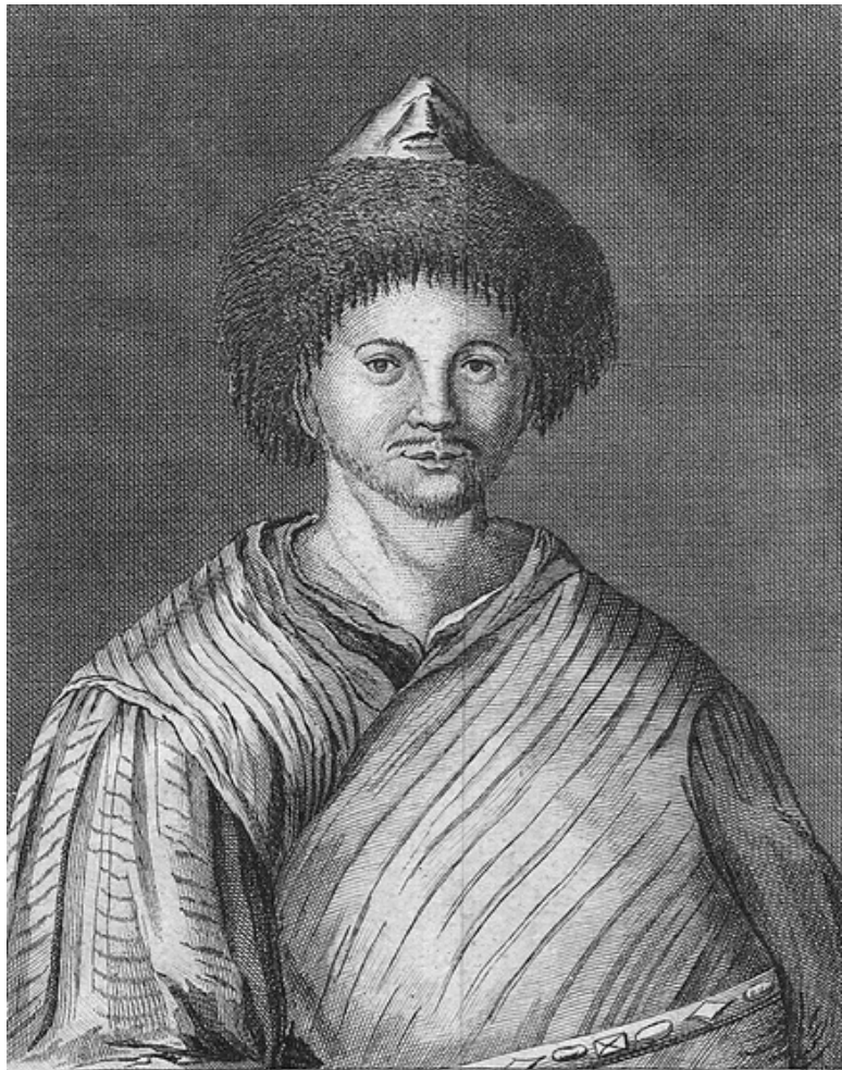
Рис. 6. Хан Младшего жуза Абулхайр-хан. Литография по рисунку Дж. Кэстля. 1736