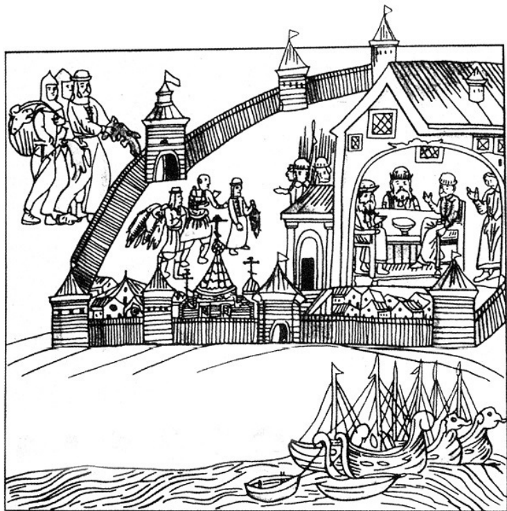
Рис. 1. Сдача ясака в Тюмени. Рисунок С. У. Ремезова из его «Служебной чертежной книги» 1699–1701 годов

Эта разница в подходах была связана с варьирующимися в зависимости от региона интересами царских правительств. На востоке целью имперской экспансии являлось прежде