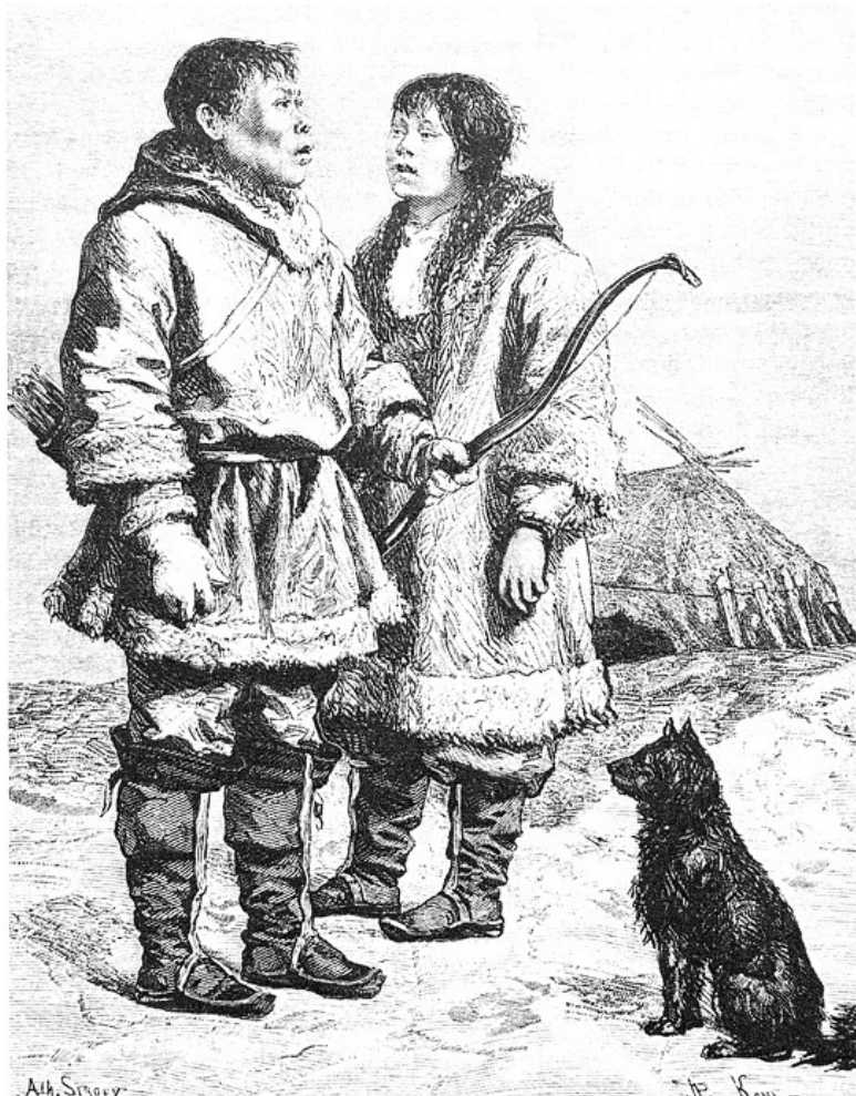
Рис. 3. Семья чукчей в кафтанах из оленьих ишкур с соба-