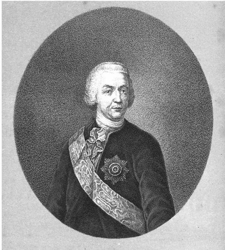
Рис. 5. Первый губернатор Оренбурга Иван Иванович Неплюев

Однако участвовавшие казахские набеги на российские по-