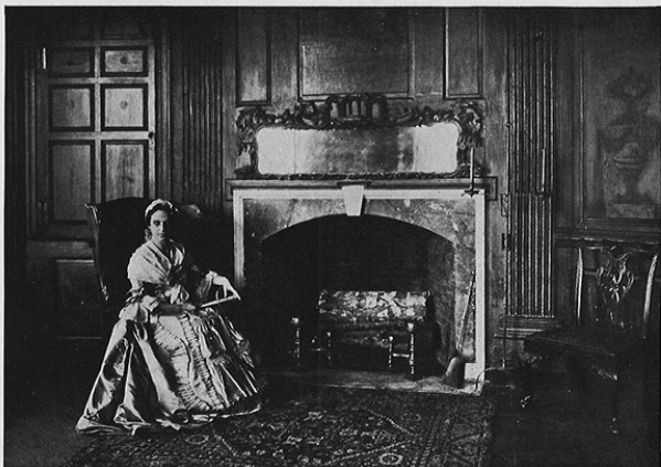
THE AMERICAN WING A MID-EIGHTEENTH-CENTURY INTERIOR