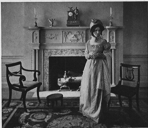
THE AMERICAN WING AMERICAN FURNITURE AND COSTUME OF THE EARLY NINETEENTH CENTURY