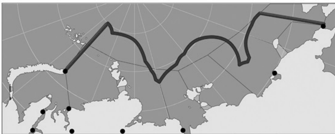
Рис. 2. Акватория Северного морского пути.

В территориальном отношении Северный морской путь имеет законодательно определенные границы (рис. 2).