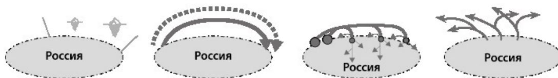
Рис. 4. Модели СМП: юридическая; географические: транзитная, центр-периферийная («северный завоз»), вывозная

Наконец, третий вариант Севморпути – это модель, как бы ни показалось парадоксальным, «ворот в Европу/Азию» (вывозная, веерная). Она очень редко заявляется в политическом контексте, однако именно по ней осуществляется хозяйственное использование Севморпути (с 1930-х – преимущественно, с начала 2000-х гг. – практически безальтернативно). Речь идет о вывозе сырья через порты Севморпути – преимущественно в Западную Европу (и далее вплоть до Африки), и в последние годы – также в Китай и другие азиатские страны. В определенной мере эта модель была заложена еще при основании Архангельска, впоследствии уступившего роль «окна в Европу» Петербургу, но наиболее активно она была развита с началом регулярного экспорта через Игарку леса (глава Замятиной), далее – норильского концентрата и, наконец, сжиженного природного газа (глава Пилясова).