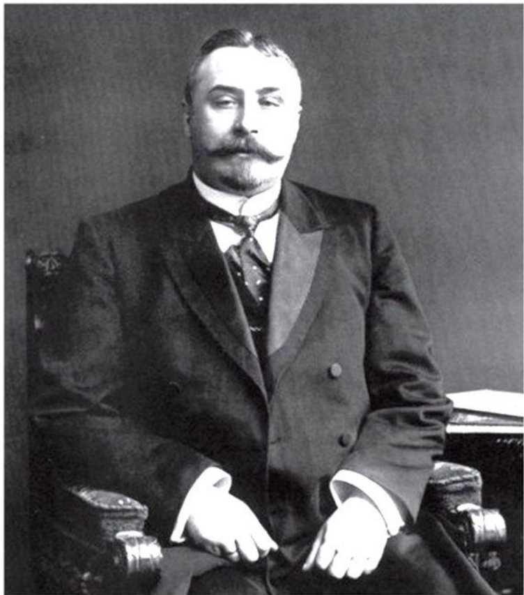
Выдающийся русский сыщик Аркадий Кошко

Аркадий Францевич Кошко-начальник Московской сыс- ной полиции 1908—1917 гг., писатель.