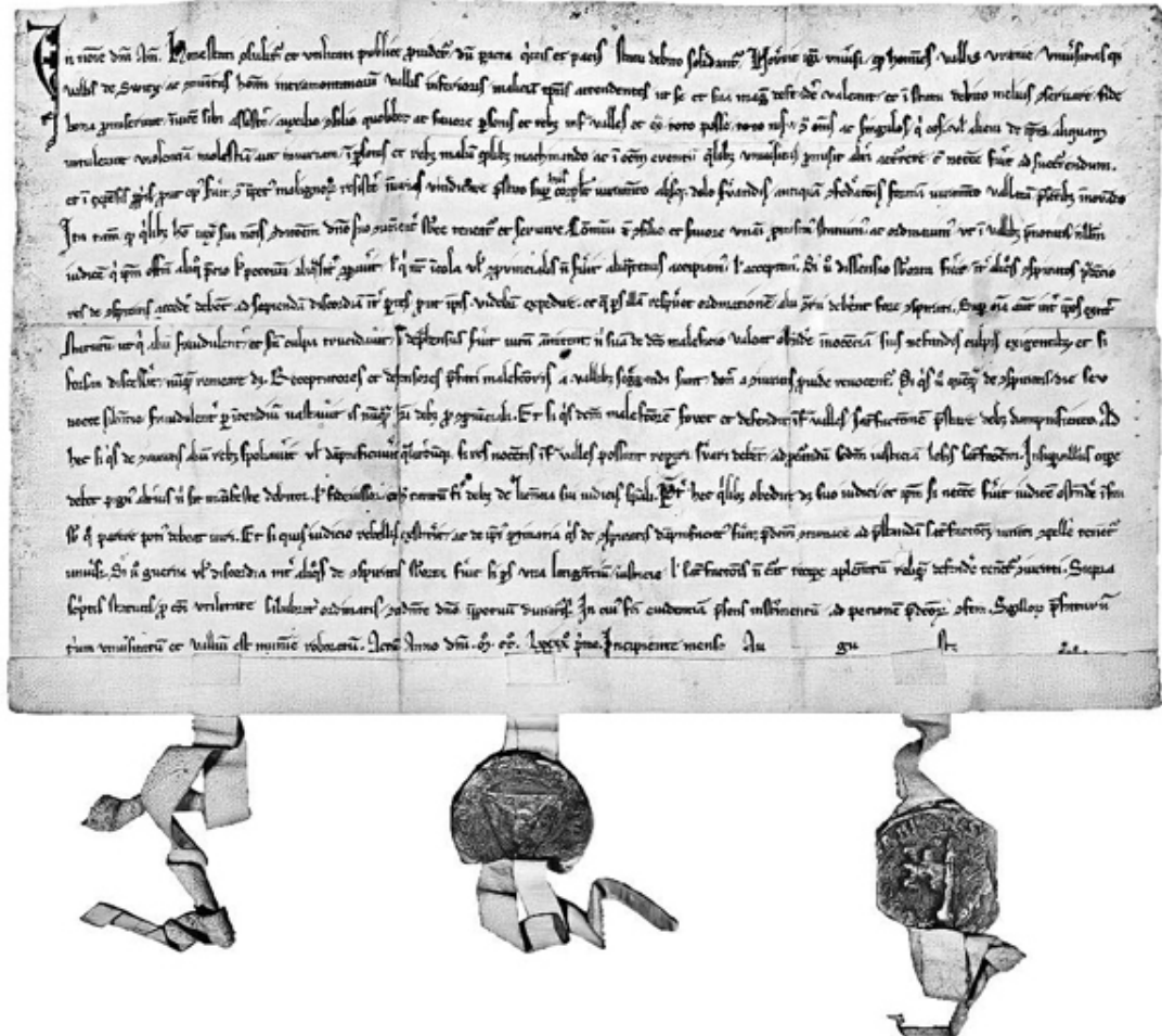
Федеративная хартия. 1291

В XI–XIII веках появились новые города, такие как Берн, Люцерн и Фрибур (Фрайбург), начала развиваться торговля. Новые технологии, применяемые в строительстве мостов, позволили начать освоение ранее недоступных территорий Альп, через которые прошли торговые пути из Средиземноморья в Центральную Европу.