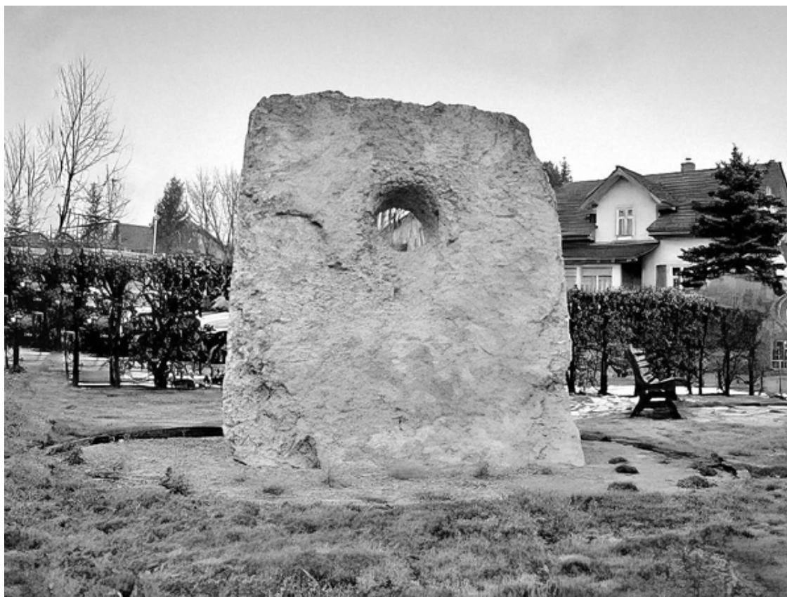
Дольмен в Пьер-Персе

Так называемая «хоргенская культура» – это археологическая культура эпохи неолита, существовавшая на территории современной западной Швейцарии. Жители данной культуры строили свайные дома на озерах, и эта культура существовала в период примерно 3500–2800 гг. до н. э.