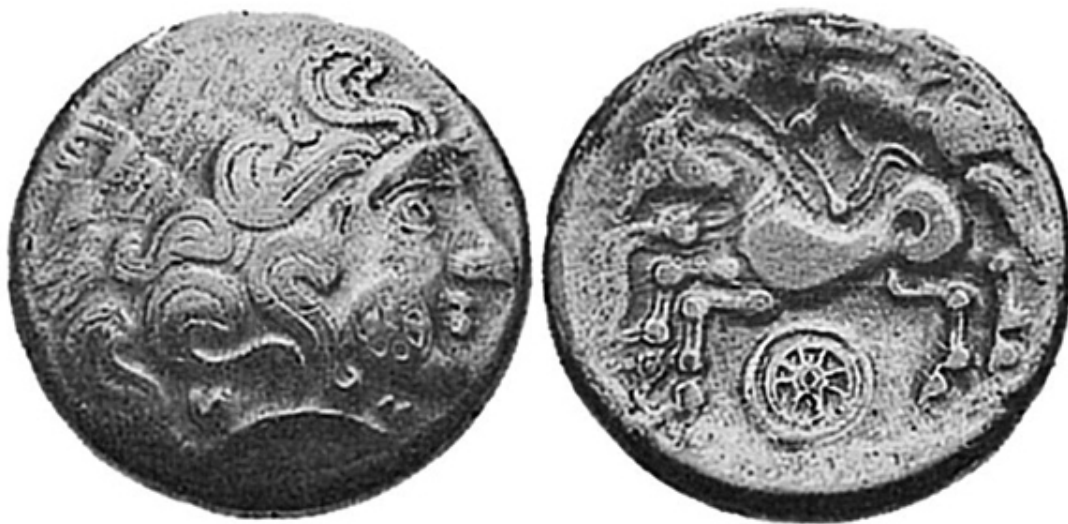
Монета гельветов. 100–80 гг. до н. э.

В 58 году до н. э. очередной набег гельветов на Южную Галлию был отбит римскими войсками под командованием Юлия Цезаря.