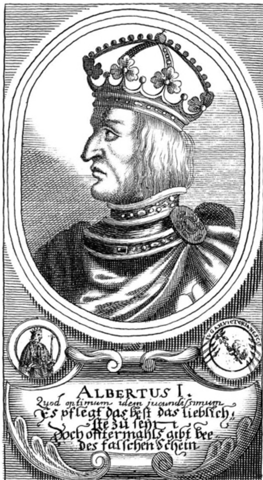
Неизв. автор. Портрет Альбрехта I Габсбурга. Между 1700 и 1799

Альбрехт I хотел еще дальше расширить свои владения и усилить свою власть. Швейцария в то время принадлежала Германии и была разделена на поместья. Однако три лесные области оставались независимыми. У жителей этих областей было самоуправление, и только