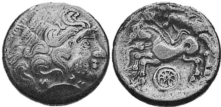
Монета гельветов. 100–80 гг. до н. э.

Гельветы вторглись в северную часть римских галльских владений и двинулись в направлении долины реки Роны, где они желали обосноваться. Римский полководец, как сообщают нам его «Записки о Галльской войне», стал строить укрепления на пути гельветов, которые были вынуждены продолжать переселение по диким землям Юры севернее долины Роны. В июне Цезарь во главе четырех легионов и 15 000 солдат союзного римлянам ополчения напал на гельветов во время их переправы через реку Арар и, не дав своим войскам отдохнуть после ночного марш-броска, атаковал противника. Воины Цезаря, сломив сопротивление гельветского арьергарда, уничтожили около 30 000 кельтов, успевших переправиться на левый берег реки. Остатки варваров двинулись в долину реки Лигер (современная Луара). Це-