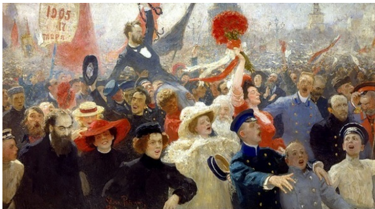
И. Е. Репин. 18 октября 1905 года

Стрельба по народу, который 9-го января 1905-го года шел к нему с иконами, как к защитнику от произвола хозяев, слепое следование советам царицы: показать народу, «кто в России хозяин», разгон Государственной думы, которая позволила себе что-то требовать, и сведение на нет избирательного права показали, что Николай и после 1905 года не был готов, даже к конституционной монархии, а тут еще и Мировая война, сделали его нетерпимым.