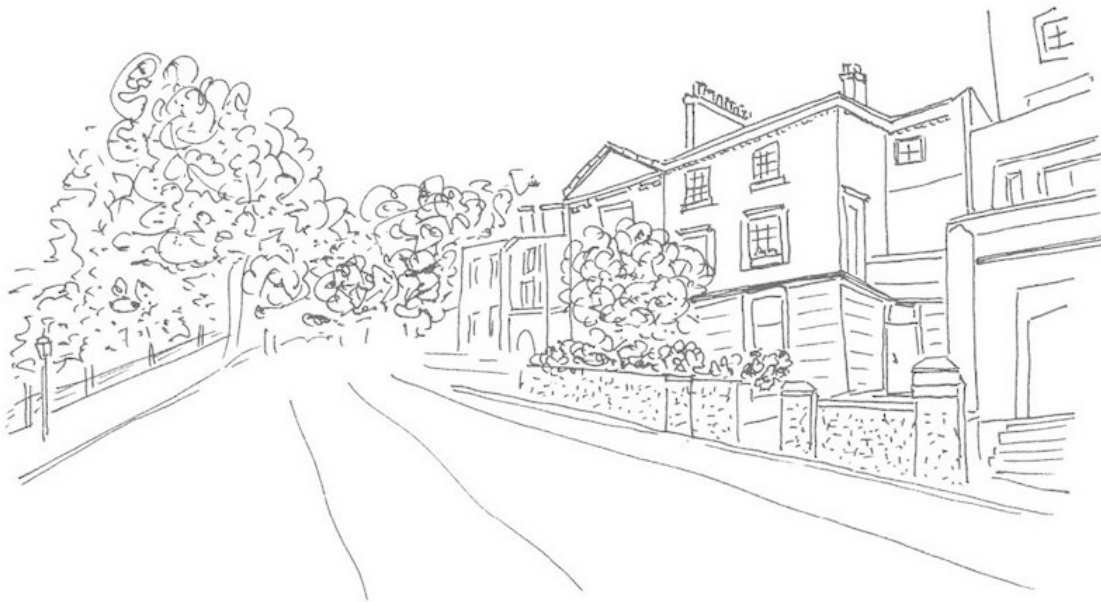
Дом Корделии, Праймроуз-Хилл

Они помахали друг другу, и «мини» сорвался с места. Корделия пошла за велосипедом. Домой она вернулась ненамного позже обычного.