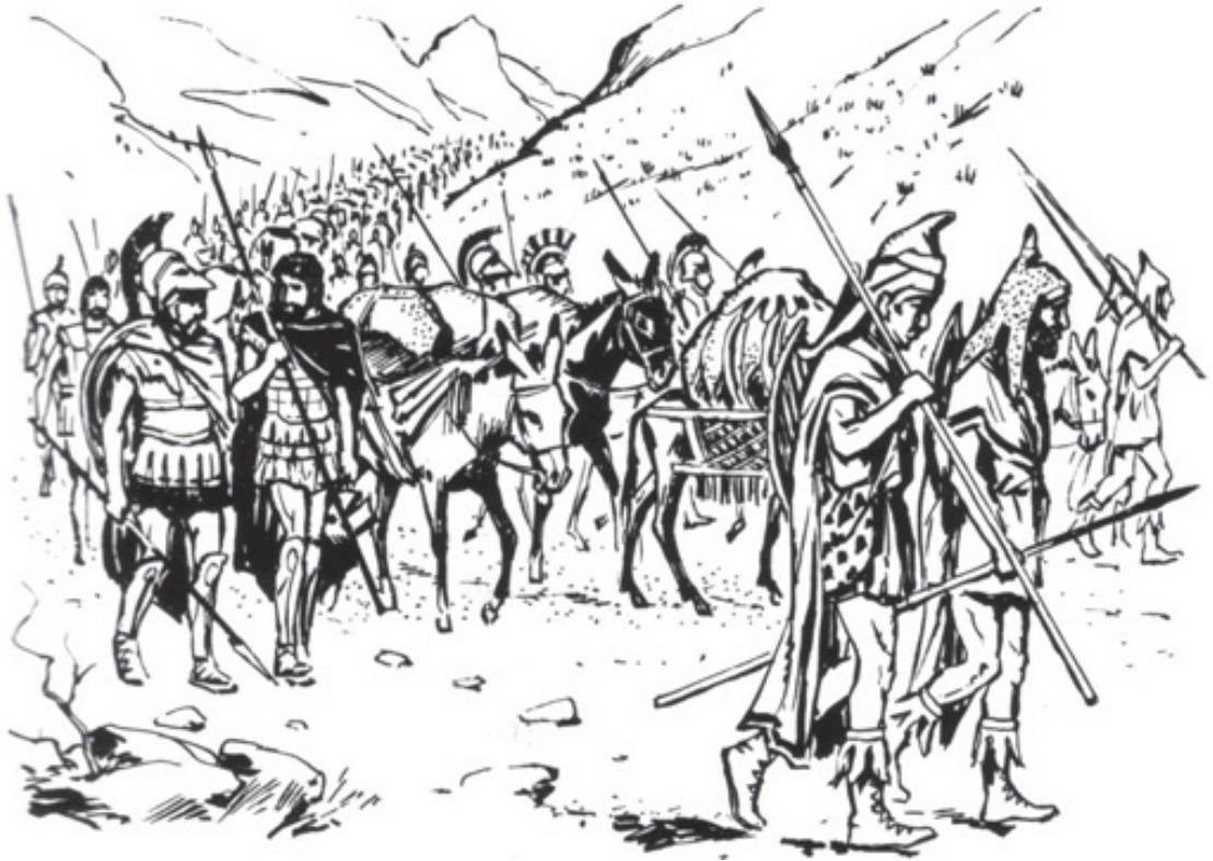
Греки в походе

Чтобы сохранить в тайне это мероприятие, воинам не говорили, для чего на самом деле их нанимают. И их собирали в различные отряды.