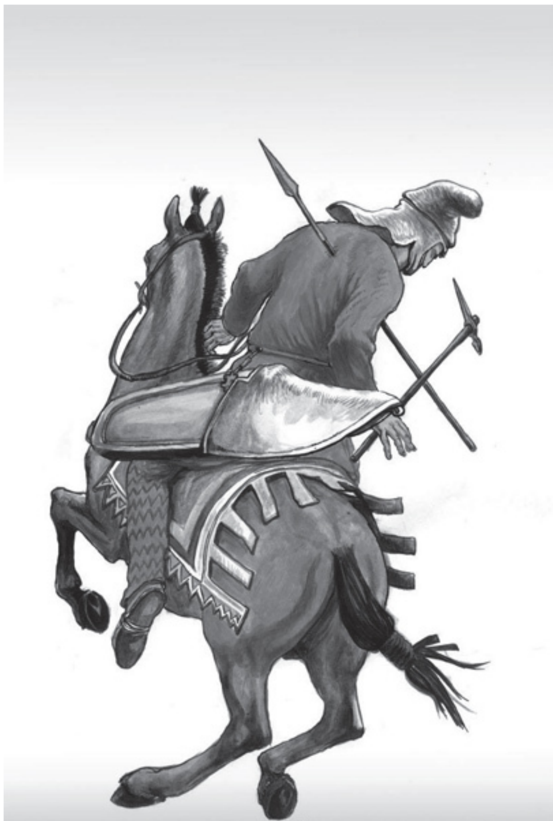
Персидский воин. Автор – Darius Wielec