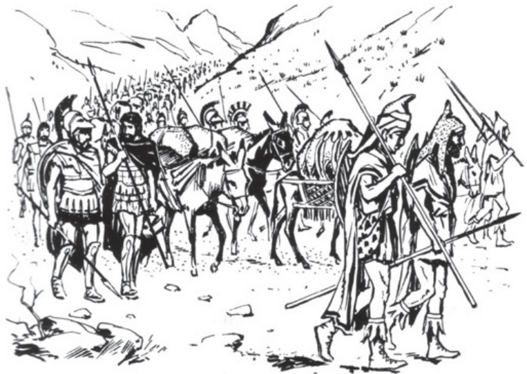
Греки в походе

и раньше нанимали греков, так что ничего принципиально нового тут не произошло. По приказу Кира набирали преимущественно тяжеловооруженных солдат, гоплитов – греки славились именно ими. Но армия, чтобы быть сбалансированным военным организмом, должна состоять из нескольких родов войск. И в качестве легковооруженных, лучников и застрельщиков, а также конницы Кир собирался использовать местные контингенты.