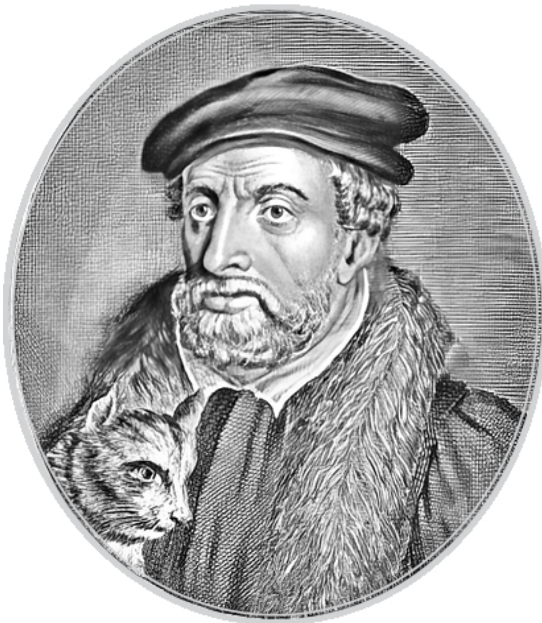
Ричард Уиттингтон и его кот. Гравюра. 1805

К чему мы вспомнили в самом начале повествования сына зажиточного глостерширского 4 дворянина (да, именно так!), впервые ставшего лорд-мэром Лондона в 1397 году? Из-за звона колоколов! Именно он заставил забежать так далеко вперед. Лон-дон! Лон-дон! Лон-дон! Какая мелодичность! Название города просто создано для того, чтобы произносить его нараспев... Лон-дон! (А теперь попытайтесь перенести юного Дика в Росланеркхраог 5 или в Драмнадрокит 6 и послушайте – станут ли вообще звонить ваши колокола?).