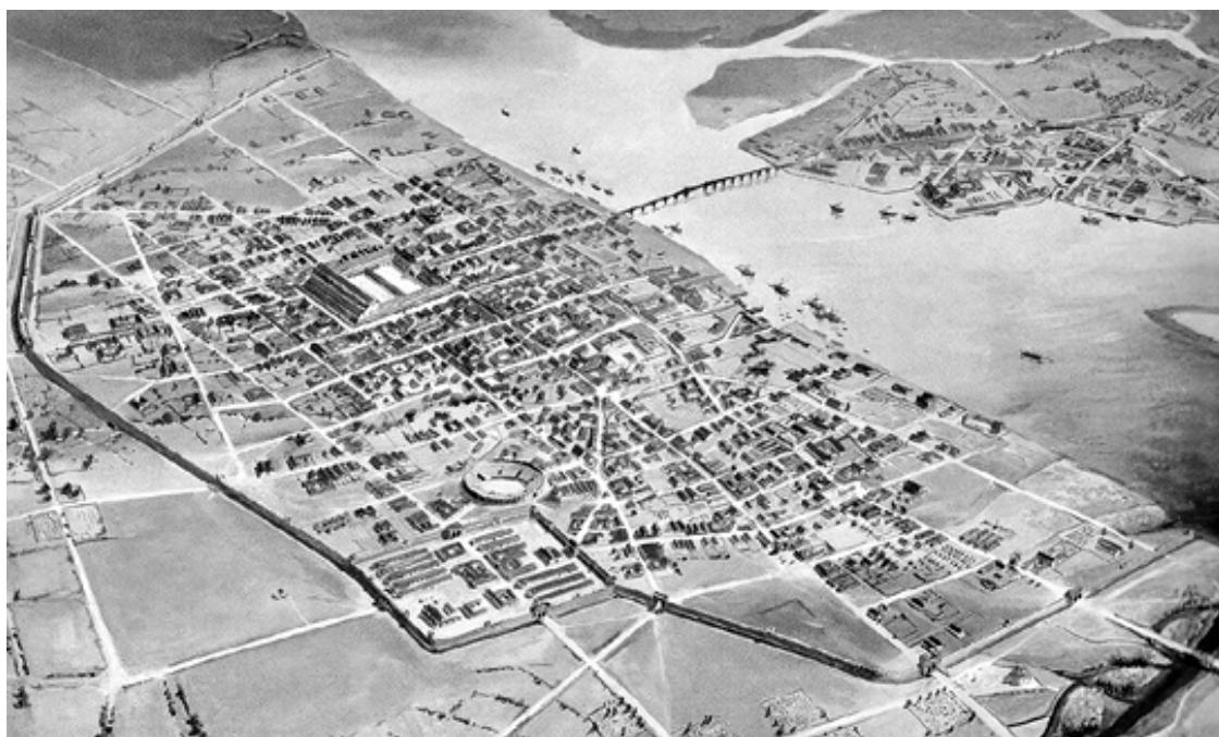
Лондиниум в I в. н. э. Современная реконструкция

Строительство растянулось на тридцать пять лет – с 190 по 225 год, но зато стена получилась впечатляющей даже по современным меркам – пять километров в длину, шесть метров в высоту и два с половиной метра в ширину. Остатки ее сохранились до нашего времени. Фрагменты стены разбросаны по Лондону. Для получения представления о стене достаточно осмотреть один из них, хотя бы тот, что находится у станции метро «Тауэр Хилл». Примечательно, что наряду с версией, согласно которой стена предназначалась для защиты Лондиниума от бриттов, существует и другая, объясняющая ее постройку внутренними римскими разборками (борьбой за императорский скипетр между наместником Британии Клодием Альбином и наместником Верхней Паннонии 15 Септимием Севером).