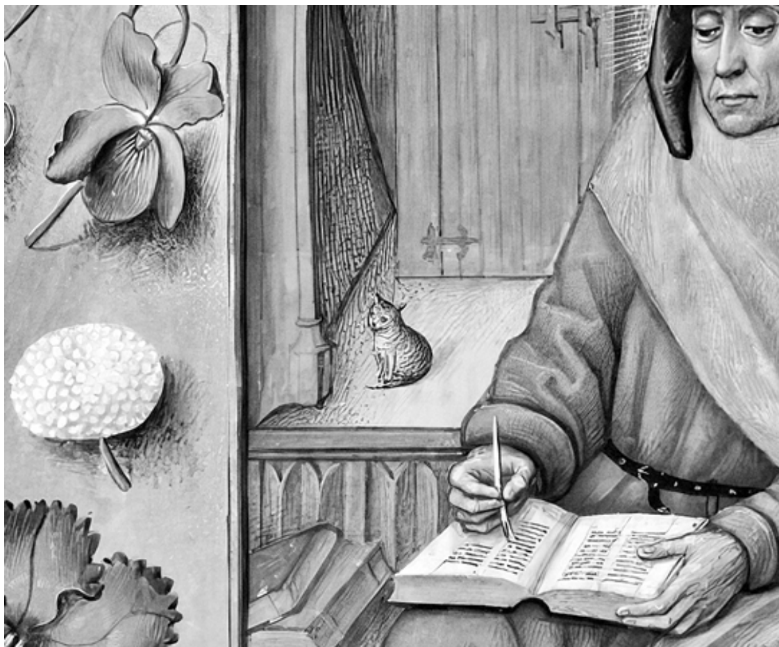
Писец и кот. Миниатюра. Фрагмент. XV век

Жизнь у Дика была та еще – ни дома, ни семьи, ни денег, ни перспектив. В поисках лучшей доли Дик ушел из родной деревни в Лондон, где ему посчастливилось найти работу на кухне богатого торговца Фитцуоррена. И все было бы хорошо, если бы не злая кухарка, которая невзлюбила Дика и всячески тиранила его, в том числе и колотила всем, что попадалось под руку. Была и другая напасть – на чердаке, где по обычаю той поры селили низшую прислугу, было очень много крыс и мышей, которые не давали спокойно спать по ночам.