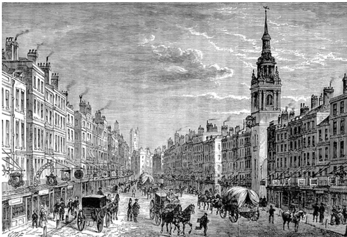
Церковь Сент-Мэри-ле-Боу. Гравюра. 1887

дяги вылавливали всех беспризорных кошек, или же Дику была нужна особо крупная кошка, с развитыми охотничьими навыками. Да и вообще к старинным преданиям следует относиться почтительно, без ехидных придирок и прочего умничанья. Умничание приводит к появлению альтернативных версий, и потомкам приходится ломать голову над тем, как оно было на самом деле. Стояла на камне наковальня или нет? Или же Артуру вообще не пришлось напрягаться с вытягиванием меча, потому что Экскалибур преподнесла ему Владычица Озера? 2 Так что мы не будем придираться к наследию, которое досталось нам от предков, а станем принимать все, как есть.