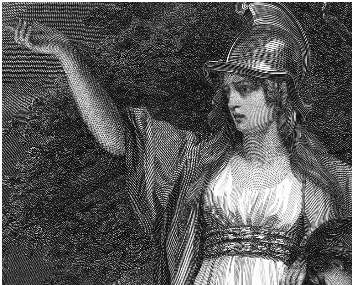
Уильям Шарп. Боудикка взывает к британцам. Фрагмент. 1793

Восстание, поднятое в 61 году вдовствующей царицей кельтского племени иценов Боудиккой, началось в удачно выбранный момент – римский наместник Гай Светоний Паулин отправился усмирять непокорных бриттов, укрепившихся на острове Мона (ныне Англси) 12 . Вдобавок к Боудикке присоединились соседние кельтские племена, в первую очередь – тринованты, жившие на территории современного Эссекса 13 . Мнения историков сильно разнятся, но, согласно наиболее достоверной версии, Боудикка вела за собой около ста тысяч воинов.