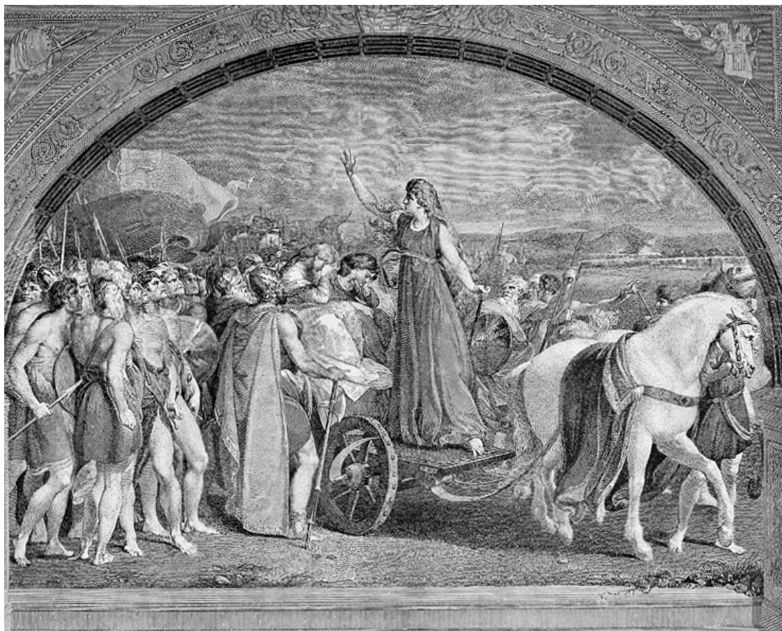
Боудикка. Гравюра. 1892

Светоний успел явиться в Лондиниум раньше Боудикки, но «учтя малочисленность своего войска... решает пожертвовать этим городом ради спасения всего остального. Ни мольбы, ни слезы взывавших к нему о помощи горожан не поколебали его решимости, и он подал сигнал к выступлению, взяв с собою в поход пожелавших ему сопутствовать; те, кого удержали от этого пол или преклонный возраст или привлекательность этого места, были истреблены врагами» 14 . Бритты не только поубивали горожан, но и сожгли дотла город, бывший для них символом ненавистного римского владычества, хотя разумнее было бы укрепиться в нем, особенно с учетом того, что он охранял важный мост через Темзу.