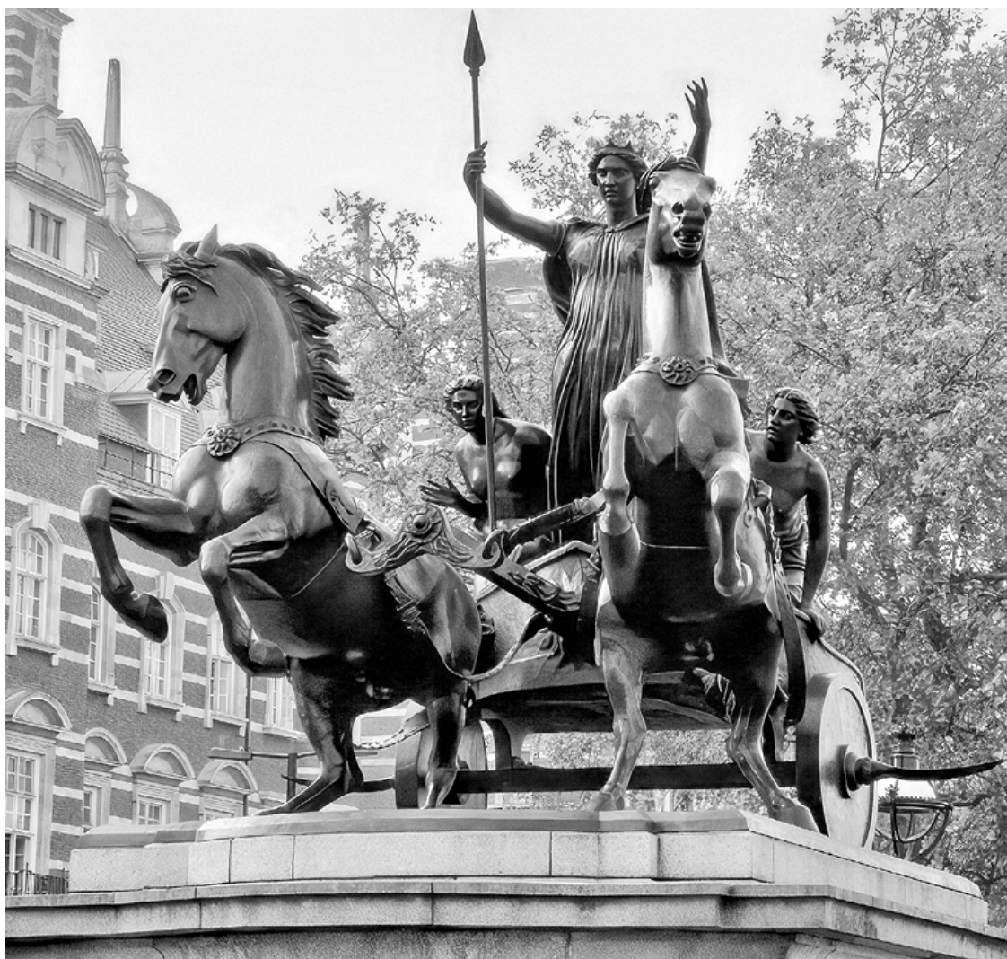
План древней Лютеции. Реконструкция XIX века

В правление королевы Виктории резко возросла популярность Боудикки, ставшей олицетворением славного национального прошлого свободлюбивых бриттов. Определенную роль сыграло и совпадение значения имен двух правительниц – и «Боудикка», и «Виктория» означают «победа». Наиболее известный памятник Боудикке, работы Томаса Торникрофта, был установлен в 1902 году в Вестминстере. Скульптор намеренно придал королеве ищенок сходство с молодой Викторией. Можно считать, что это памятник королеве Виктории в образе Боудикки. Против истины Торникрофт несколько не погрешил, потому что никто не знает, как выглядела настоящая Боудикка.