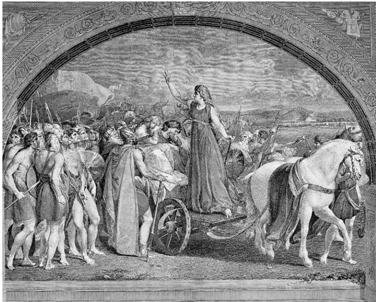
Боудикка. Гравюра. 1892

Светоний успел явиться в Лондиниум раньше Боудикки, но «учтя малочисленность своего войска... решает пожертвовать этим городом ради спасения всего остального. Ни мольбы, ни слезы взывавших к нему о помощи горожан не поколебали его решимости, и он подал сигнал к выступлению, взяв с собою в поход пожелавших ему сопутствовать; те, кого удержали от этого пол или преклонный возраст или привлекательность этого места, были истреблены врага-