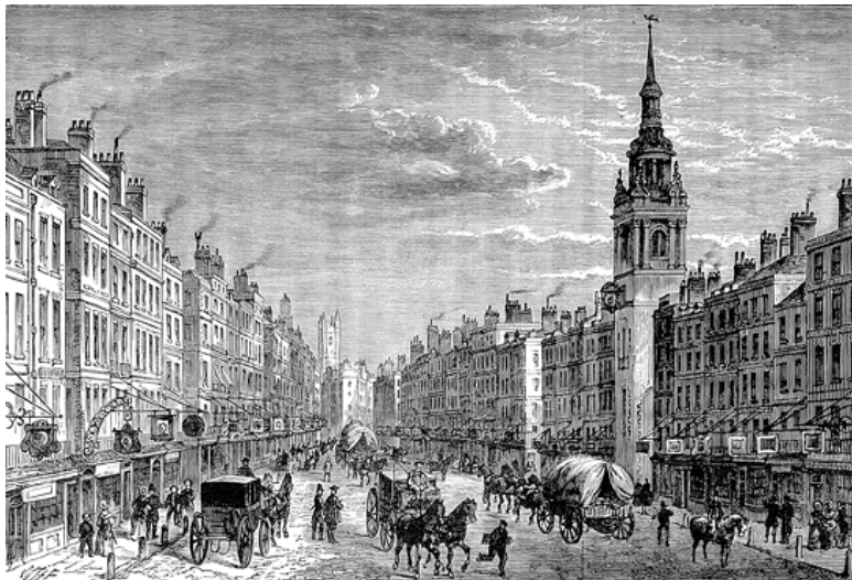
Церковь Сент-Мэри-ле-Боу. Гравюра. 1887

Итак, Дику нужна была кошка. Он купил ее на пенни, заработанный чисткой обуви, поселил в своей каморке и с тех пор наслаждался покоем по ночам. Но тут судьба приготовила ему искушение. Фитцуоррен снарядил в заморские края очередной корабль и предложил своим слугам попытать счастья, дав капитану что-нибудь для продажи. Затея была рискованной – выгорит дело или нет? – да и с кораблем всякое могло случиться, но все слуги откликнулись на предложение. Даже Дик соблазнился и отдал капитану свою кошку, поскольку больше никакого движимого имущества у него не было. Отдал – и вскоре пожалел, потому что мелкая чердач-