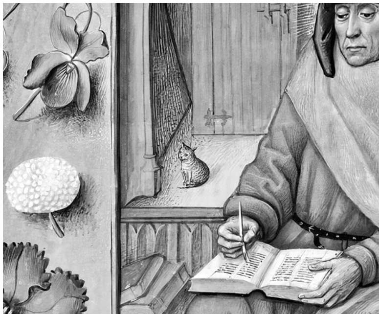
Писец и кот. Миниатюра. Фрагмент. XV век