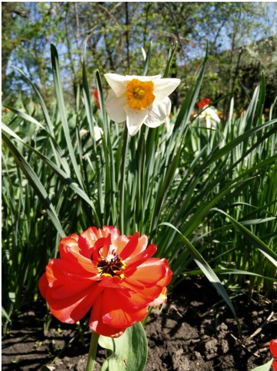
Радость весны, 06.05.2015 г.