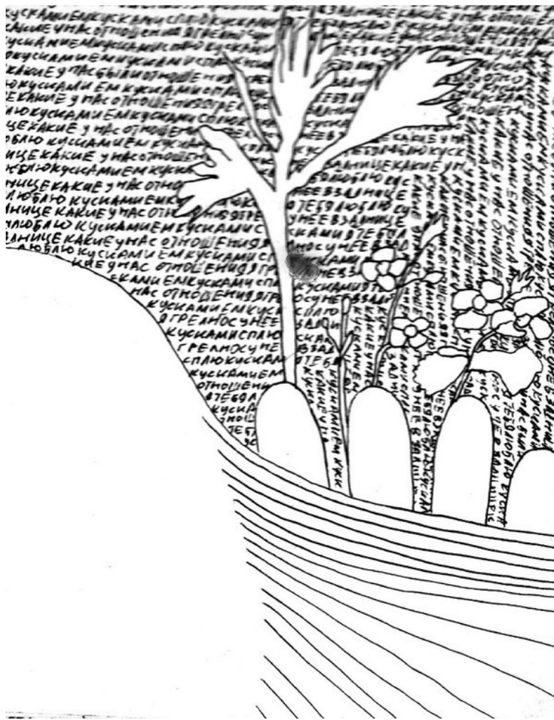
Незабудки мыслей (рис. Кошкин К.)