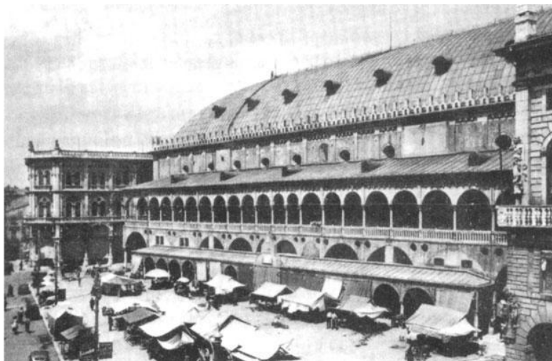
Палаццо делла Раджоне. Падуя, 1219–1309

la cité [душа города], иными словами – качество фактов городской среды. В результате французские географы разработали важную систему описания, но не стали даже пытаться взять последний рубеж своих исследований: отметив, что город выстраивает себя в своей целостности, которая и составляет его la raison d'être [смысл существования], они оставили неизученным значение выявленной структуры. Да они и не могли поступить иначе, учитывая предпосылки, от которых они отталкивались; все эти исследователи откладывали на потом анализ конкретики, присутствующей в отдельных фактах городской среды.