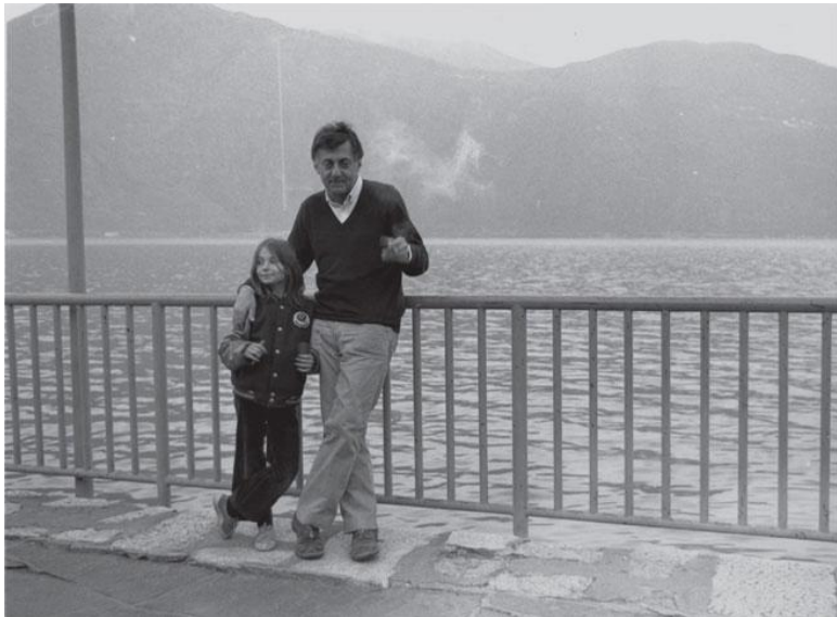
Альдо Росси с дочерью Верой, ок. 1980