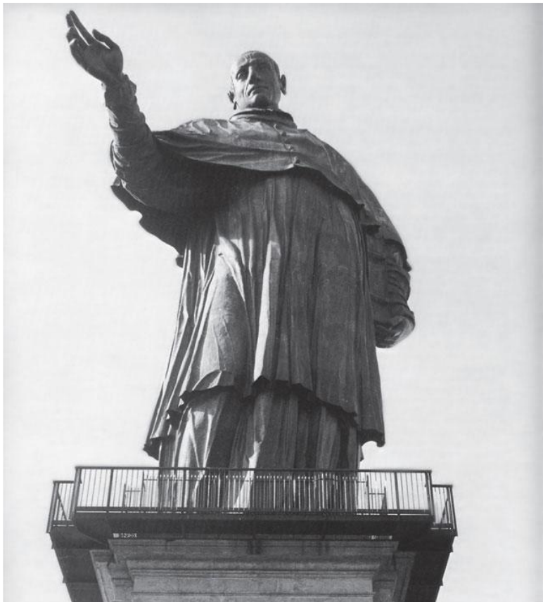
Статуя святого Карло Борромео, Арона

Поэтому со временем я стал воспринимать архитектуру как инструмент, позволяющий чему-либо произойти. Надо