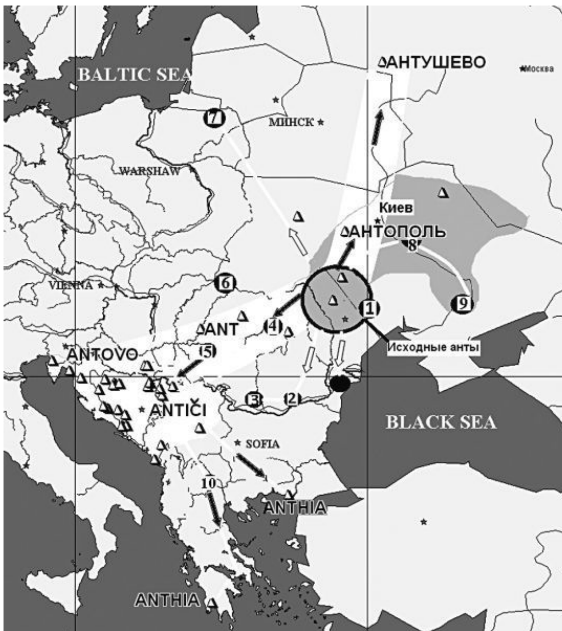
Карта № 3. Расселение антов. ● – данные археологии; ■ – территория Пеньковской культуры. △ – топонимы «ant»

Поначалу наибольшая плотность антского населения наблюдается на севере верховий Прута и Днестра, в бассейне его притоков Сирет и Збруч. Западнее Днестра ранних антов не было. Далее последовало заселение прудо-днестровского междуречья (Карта № 3). (К рассмотрению топонимики мы приступим несколько позднее.) Отсюда они расселяются на юг в Нижнее Поднестровье (1) и начинают продвижение на Балканы. Другой поток движется на земли Буковины и спускается на юг по Сирету (2), в провинцию Мунтения, выходя значительно выше дельты Дуная. Здесь осуществился контакт с романо-дакийцами. Некоторые группы продвинулись далее за Олт (3). Другая группа смещается к западу от Прута (Ботошаны) и оказывается в Дакии(4), где играет главенствующую роль в союзе со словенами. Анты отмечаются в области гепидов Южной Трансильвании (5), а также в верховьях Тисы (6). В конце VI века они осваивают дельту Дуная и Скифию, где возникают словено-антские поселения. В результате смешения с дулебами возникает луко-райковецкая культура.