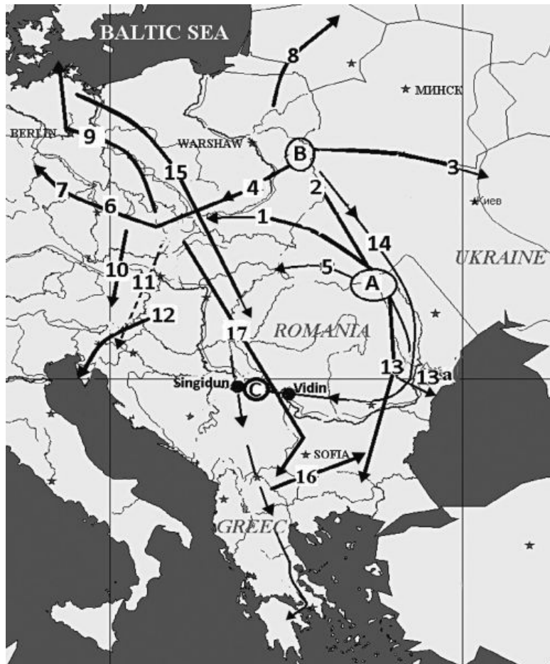
Карта № 1. Расселение словен (славян) в Западной Европе по данным источников