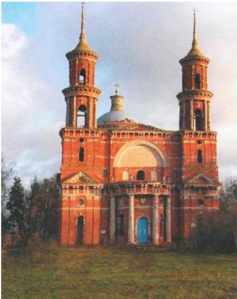
Рис. 3. Храм в селе Баловнево Данковского уезда. Снимок 90-х гг.

В городе были торговые ряды с обширной замощенной торговой площадью, где по воскресеньям организовывался привозной рынок сельхозпродуктов и живности, включая продажу коров, свиней и лошадей, которых было в уезде несколько тысяч. Весь транспорт и обработка земли основывалась на конном приводе. Ярмарки, проводимые обычно к осени, были огромны. Яблоки и овощи продавались без весов – ведрами, мерами (малое ведро).