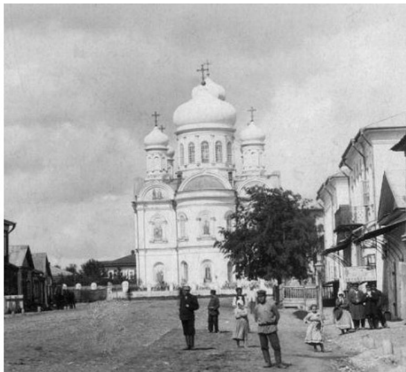
Рис.2. Тихвинский собор в центре г. Данкова. Снимок до революции 1917 г.

новится малым центром православия. В центре города возвышается большой 2-х этажный Тихвинский Собор, основанный в 1861 г., с высокой колокольной-звонницей. При слиянии рек был образован мужской Покровский монастырь, построены Духовное училище, гимназия, больница, городской сад с кинотеатром, тюрьма, почта, телеграф, хорошая городская библиотека, собранная из фондов бывших купцов и дворян.