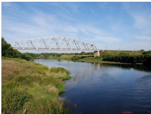
Рис.1. Река Дон у железнодорожного моста.

здателям сайтов, «раскопавшим» историю города. Я использую эти сайты в своих воспоминаниях для описания Данкова, так как без привязки к месту многие события будут непонятны для читателя.