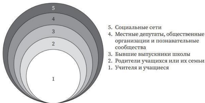
Рисунок 2. Наглядная схема информирования граждан о практических делах

И все они непосредственно и опосредованно распространяют информацию о делах органов власти, такая информация пользуется высоким доверием и имеет поддержку из разных источников. Схематически это показано на рисунке 2.