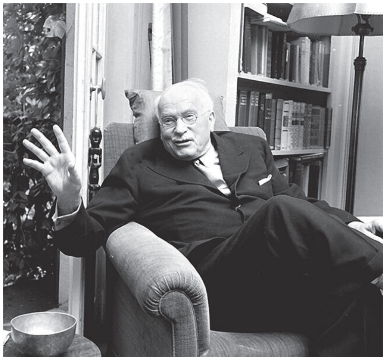
К. Г. Юнг

Насекомых я считал «ненастоящими» животными, а позвоночные для меня являлись лишь какой-то промежуточной стадией на пути к насекомым. Создания, относившиеся к этой категории, предназначались для наблюдения и коллекционирования, они были интересны в своем роде, но не имели человеческих свойств, а были всего-навсего проявле-