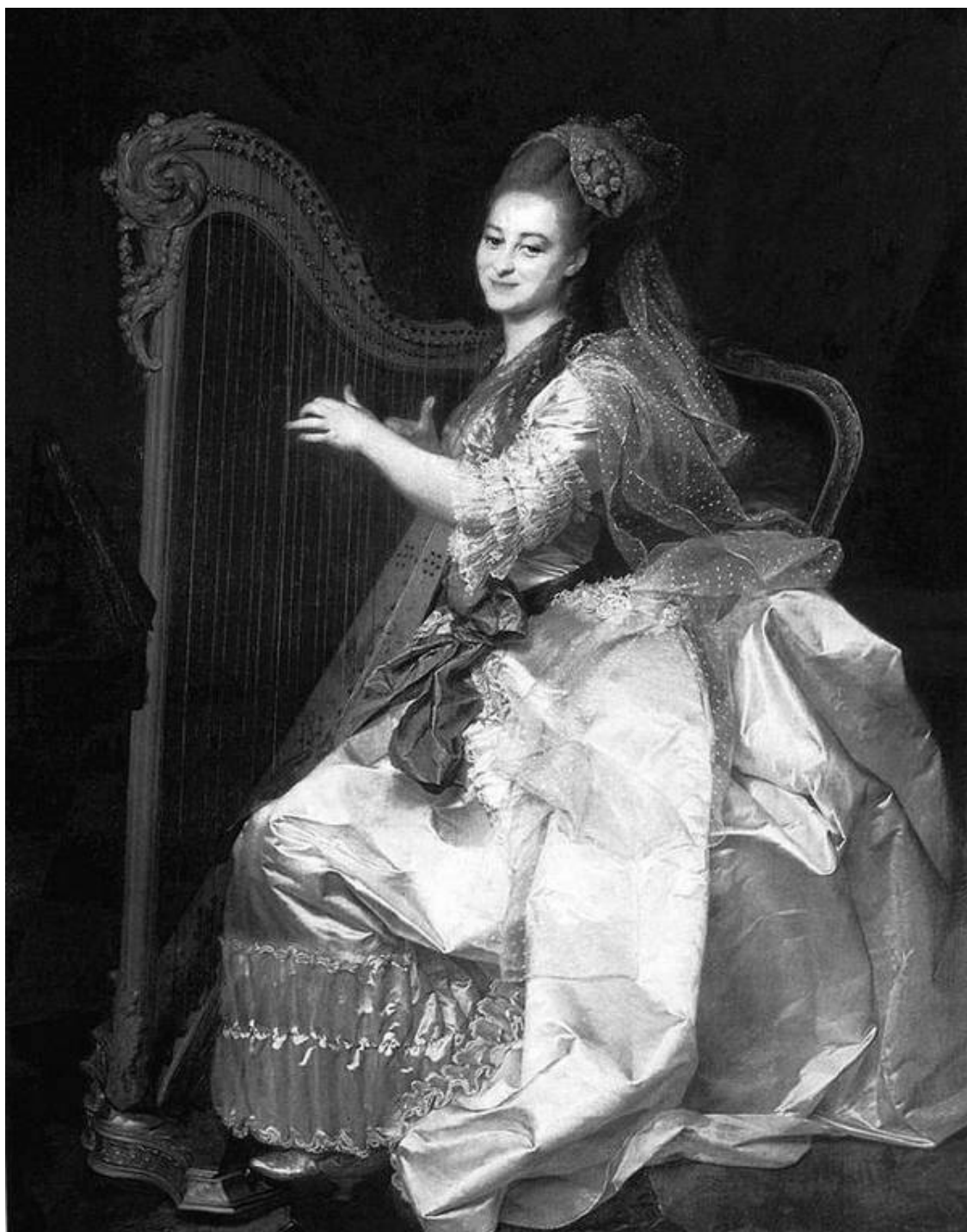
Портрет Г. И. Алымовой. Художник Д. Г. Левицкий. 1776 г.

Глафира Ивановна Алымова, в первом браке Ржевская (1758—1826) – фрейлина Екатерины II, одна из первых арфисток. Входила в первый выпуск института 1776 года, закончила воспитание «первою» и была награждена золотой медалью первой величины и «знаком отмены» – золотым вензелем Екатерины на белой ленте с 3 золотыми полосками