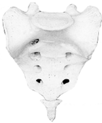
Рис. 3. Крестец

В основном встречаются два вида деформации грудной клетки. «Куриная грудь» при осмотре определяется резко выступающей вперед грудиной, прикрепленные к ней ребра лежат с ней не в одной плоскости, а под острым углом. В результате грудная клетка суживается и уплощается, ее объем значительно уменьшается. Легкие, сердце и сосуды находятся в более стесненных условиях, что ухудшает их нормальное функционирование и развитие. «Впалая грудь» характеризуется тем, что грудина и ребра своим вдавлением в грудную клетку образуют «воронку».