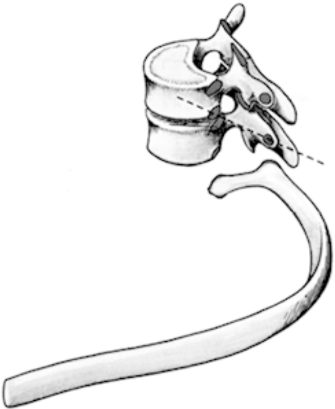
Рис. 2. Грудной позвонок

Грудную клетку формирует грудина, 12 пар ребер