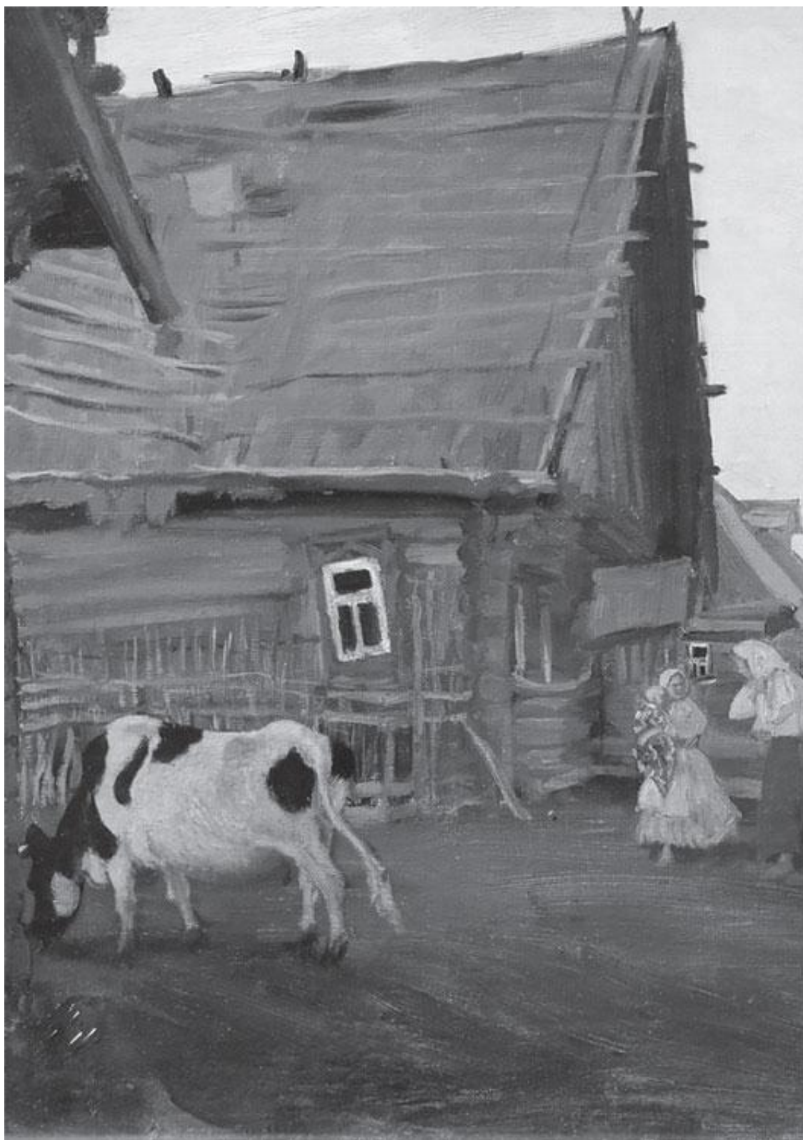
Б. Кустодиев. Изба. Костромская губерния, 1909–1917