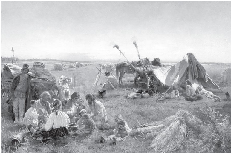
К. Маковский. Крестьянский обед в поле, 1871. Во время уборочных работ крестьяне проводили в поле весь день