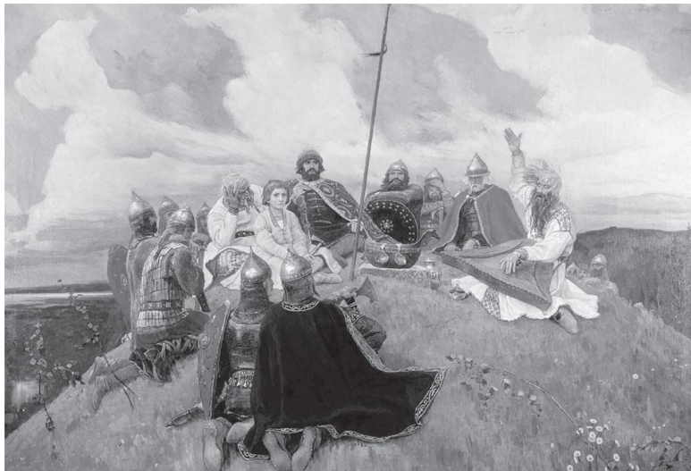
В. Васнецов. Баян, 1910. Вещий Баян слагал песни и сказания о деяниях князей