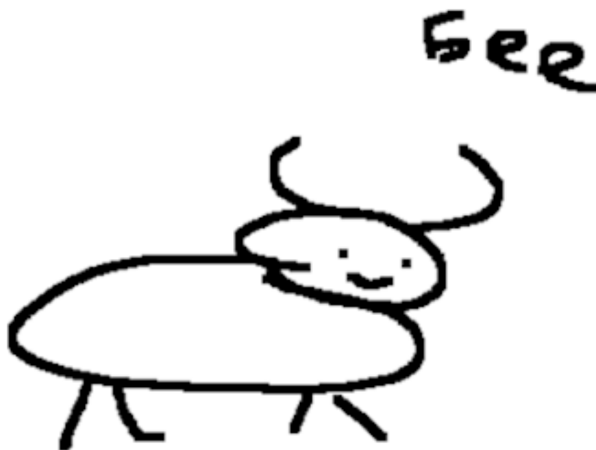
Рисунок 6. Делать одни и те же действия и надеяться на новый результат глупо