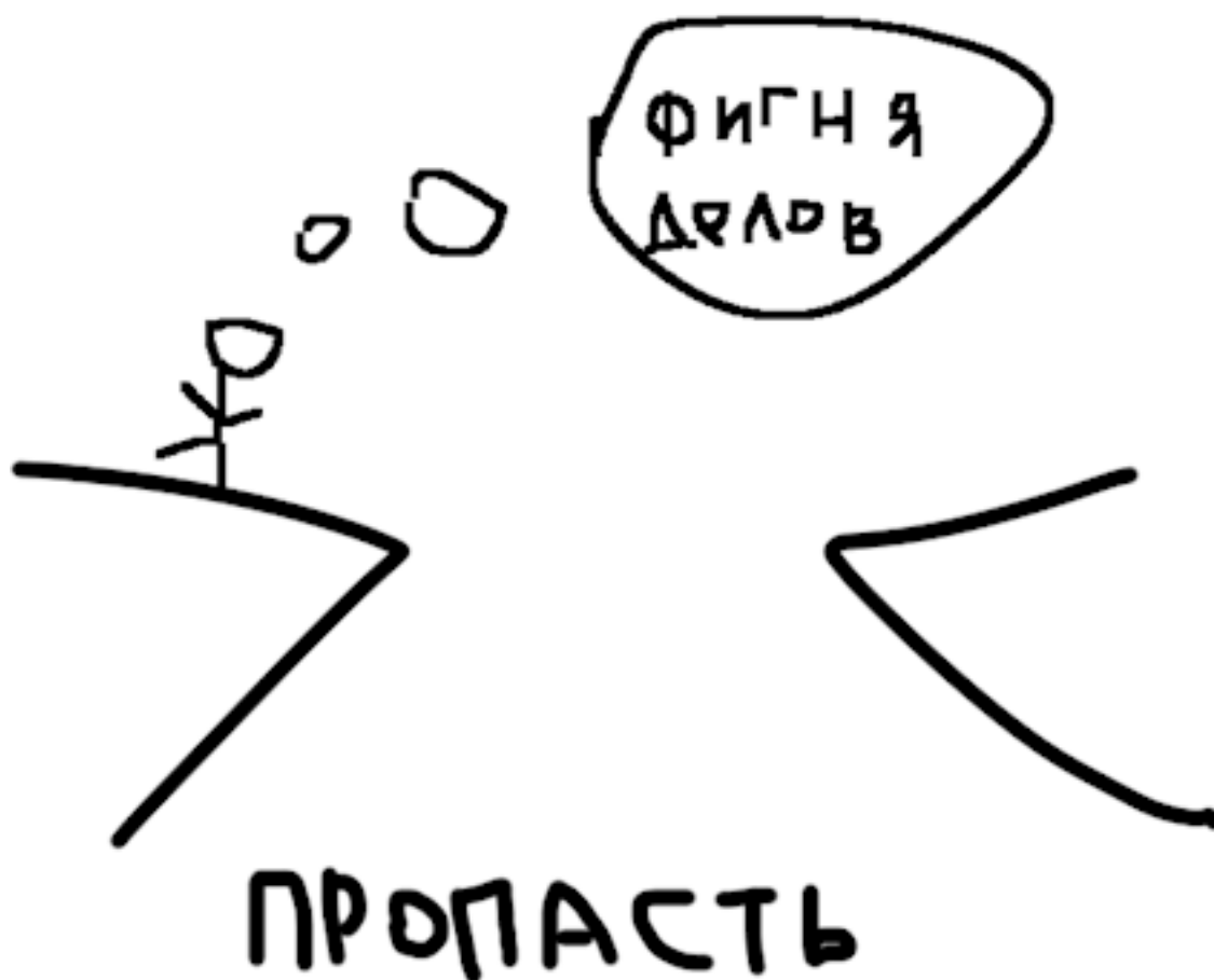
Рисунок 6: Слабоумие и отвага во всей красе

Я занимался себе спокойно торговлей товарами, но мне не нравилось то, что постоянно приходится искать новых клиентов, что продукт повторно не покупают и нет бренда, который нравится людям. И тут ко мне приходят знакомые, которые продают бар. Я думаю: вот она тема! Постоянные клиенты будут ходить, кальяны, вечеринки, стану крутым. Не разобравшись толком в отчетах, я договорился на рассрочку и влез в новую тему. Одним словом – слабоумие и отвага. Сумма сделки была около 2 млн. Вписался я в ноябре. Последние 2 месяца года закрыли более-менее нормально. Затем начался кризис.