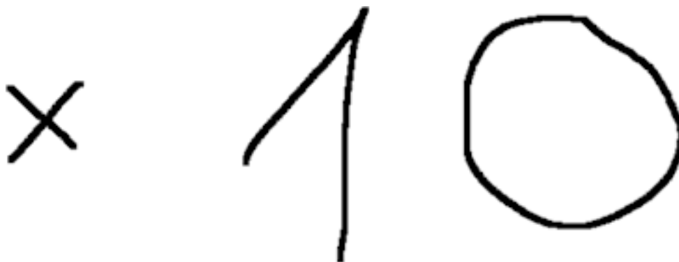
Рисунок 5. Делал наценку до того, как это стало мейнстримом

Когда я заново начал заниматься сим-картами после краха MMM и неудачного открытия шоурума с одеждой BLACKSTAR, познакомился с соседями по офису, которые занимались продажей китайских часов. Они покупали их по 80 рублей на рынке и по 890 рублей продавали в интернете. Я, признаться, был в легком шоке от такой наценки, но решил попробовать. Учился у ребят, мой отзыв где-то до сих пор в интернете есть, и у меня начало получаться. Да так хорошо, что ко мне стали обращаться знакомые с просьбой рассказать и показать, как им тоже торговать китайскими часами в интернете.