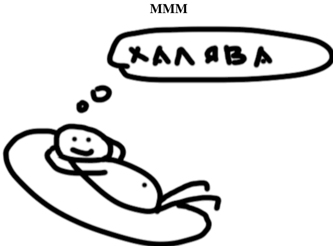
Рисунок 4. Как я представлял себе МММ

С МММ влетел я знатно. Я работал по 12–14 часов в сутки, развивал бизнес по симкам, а рядом знакомые вкладывали деньги в МММ и за месяц получали какие-то сумасшедшие проценты. Я им завидовал и тоже повелся на эту тему. Вложил свои деньги, обернул их за месяц, получил проценты и начал привлекать в МММ знакомых. За привлечение платили, и я активно стал это делать. Для усиления эффекта я говорил, что полученные деньги не передам в структуру МММ и они будут только у меня храниться. Так, в общем-то, и было, но в итоге в конце месяца мне позвонили и сказали, что надо перевести или процентов не будет.