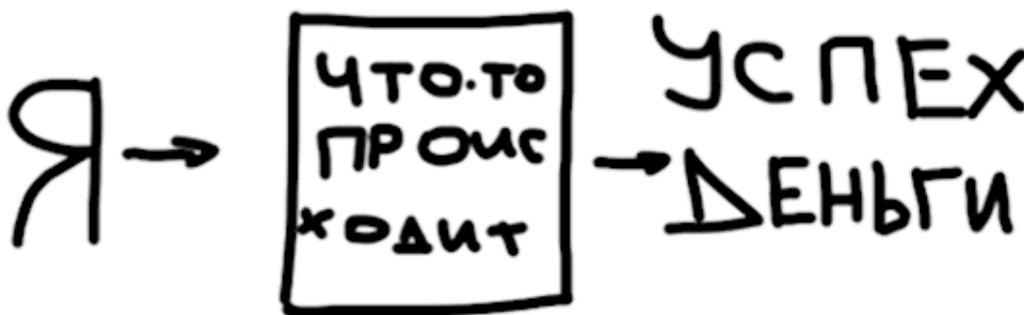
Рисунок 2. Моя формула успеха. Между мной и успехом – черный магический ящик, который сам за меня все сделает, надо просто подождать

Хорошие моменты в сетевом маркетинге тоже были: я научился строить команды, выступать публично, прошел обучение работе с людьми. Но из-за того, что продавать мы не умели, структура не зарабатывала: нас много, продаж мало, а значит, нет и дохода. Я не понимал причинно-следственных связей, не понимал, что деньгам неоткуда взяться, если не продается продукт.