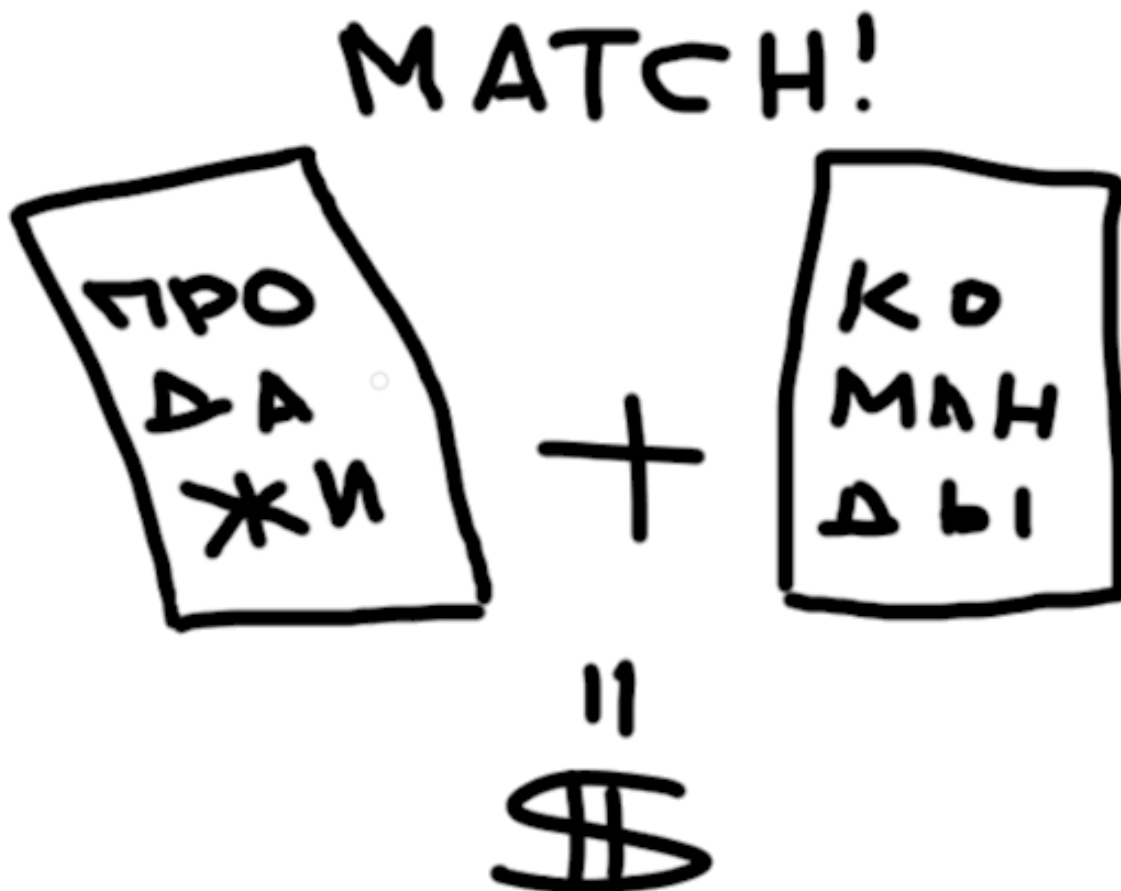
Рисунок 3. Все, как учил Кийосаки, я шел по этапам

Спустя еще один месяц я стал лидером по продажам данной компании, и мне разрешили набрать команду, потому что я уже умел это делать, но не умел продавать. А сейчас все совпало: я научился продавать и строить структуры.