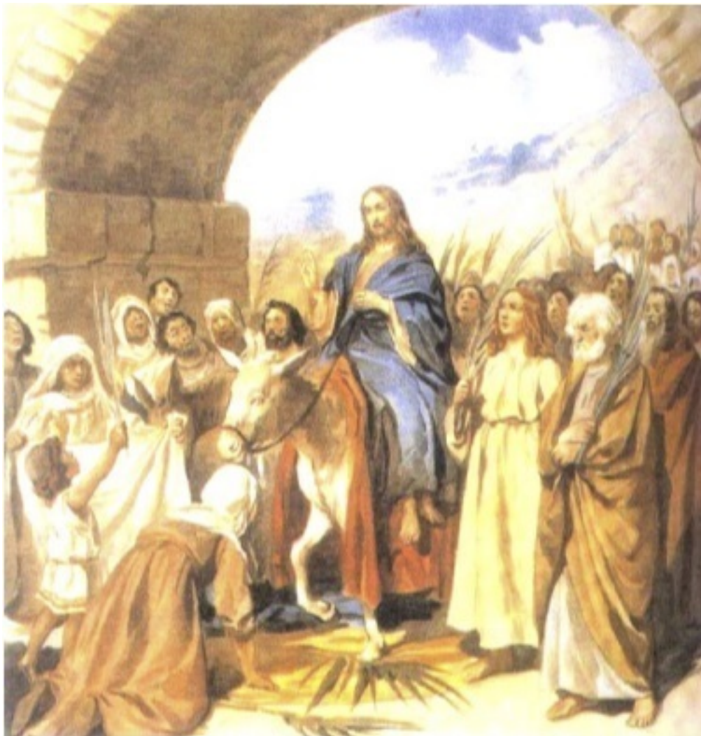
К.В. Лебедев. Вход Господень в Иерусалим.

На третий год своих странствий, накануне праздника Пасхи, Иисус торжественно въехал в Иерусалим верхом на осле, сопровождаемый учениками и толпами простого народа, восклицającego: «Осанна!» – так, как должны были приветствовать самого Мессию. Это было последней каплей, переполнившей неглубокую чашу терпения фарисеев.