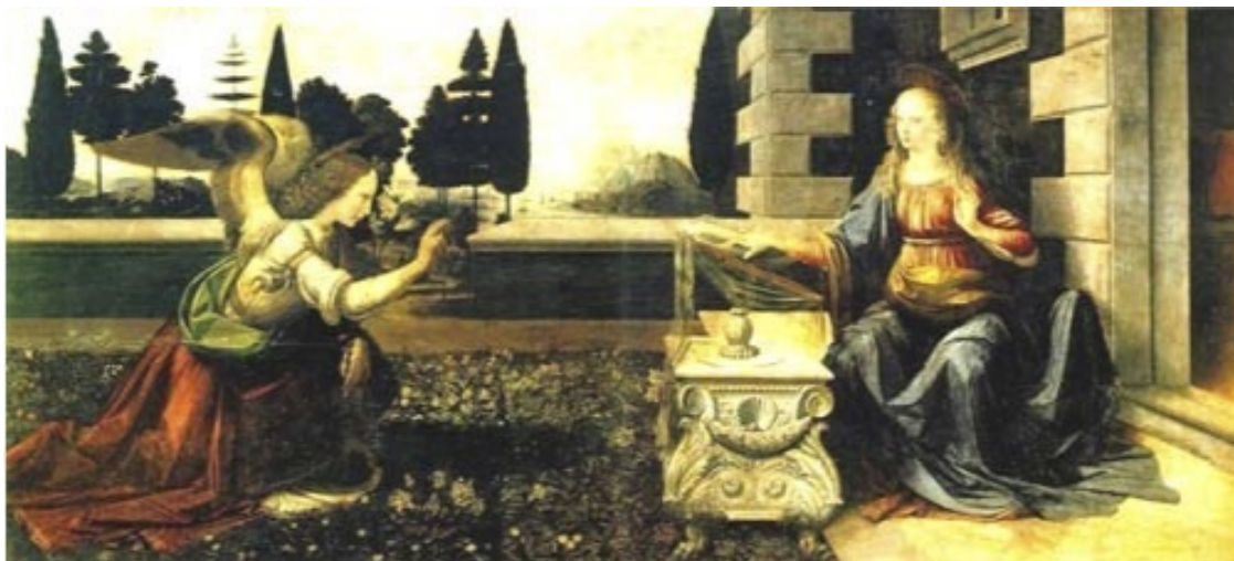
Леонардо да Винчи. Благовещение.

Одновременно это было исполнением всех обетований, которые давал Бог иудейскому народу, так как воплотился Богочеловек среди евреев и именно он был Священным Помазанником, Мессией и новым царем Израиля, но царем «не от мира сего». (Напомним, что сами слова «мессия» и «христос» означают «помазанник»). Даже на свет он должен был появиться в роду, который вел своё происхождение от самого царя Давида. Зачатие Христа было чудом, так как его мать – дева Мария так и осталась девственницей. Весть о том, что она будет матерью воплощенного Бога, зачатого по действию Духа Святого, Марии, жене престарелого плотника Иосифа, передал посланник Бога– архангел Гавриил.