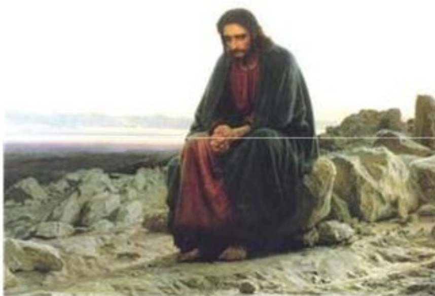
И. Крамской. Христос в пустыне.

Но Иисуса ждало ещё одно испытание. Удалившись в пустыню, он размышлял там 40 дней и ночей, соблюдая строгий пост. И вот когда пост уже заканчивался, ему явился Сатана, злой дух, противник Бога, на заре мироздания взбунтовавшийся против своего Создателя и отныне ставший повелителем всех сил зла. Сатана стал искушать Иисуса, предлагая ему сначала явить свое могущество, а затем уже и просто склониться перед владыкой зла, обещая за это власть над миром. Иисус отверг соблазны Сатаны и прогнал его, сказав, что следует поклоняться только одному Богу. Победа над Сатаной стала рубежом, после которого начинается явная проповедь Иисуса Христа.