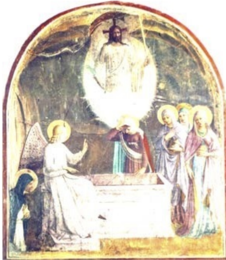
Фра Анджелико. Воскресение Христово.

Воскресший Иисус неоднократно являлся своим ученикам, беседовал с ними и, наконец, повелел апостолам отправиться проповедовать его учение по всему миру. После этого Христос оставил своих учеников и вознесся к своему Небесному Отцу. Бог Сын предсказал свое возвращение на Землю в «конце времен», чтобы судить живых и мертвых.