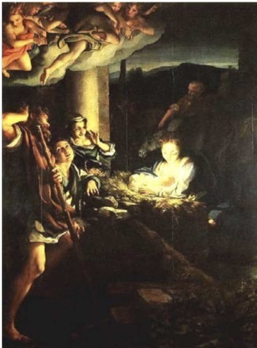
Корреджо. Рождество Христово.

Рождение его сопровождалось чудесами. Сонмы ангелов явились в небесах, возвещая, что родился Сын Божий. И наконец, к хлеву в Вифлееме явились три восточных мудреца – мага («волхва») из Персии, чтобы поклониться явившемуся Спасителю мира.