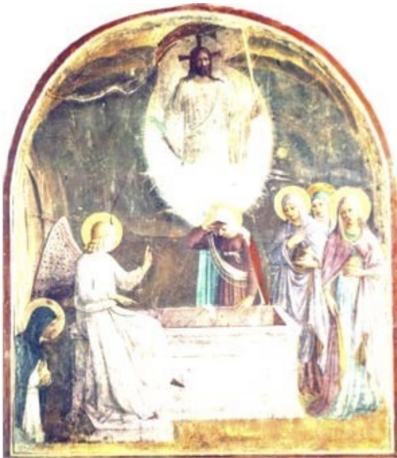
Фра Анджелико. Воскресение Христово.

Воскресший Иисус неоднократно являлся своим ученикам, беседовал с ними и, наконец, повелел апостолам отпра-