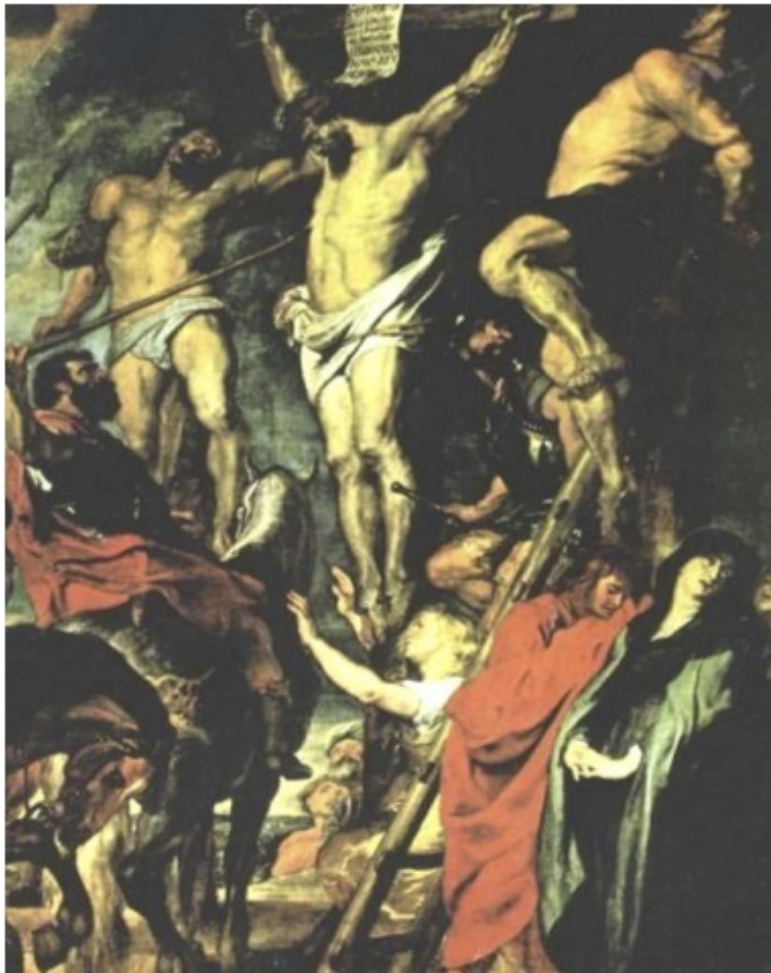
П.П. Рубенс. Пронзание Христа копьем.