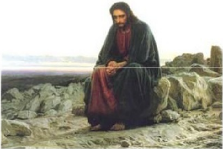
И. Крамской. Христос в пустыне.

товавшийся против своего Создателя и отныне ставший повелителем всех сил зла. Сатана стал искушать Иисуса, предлагая ему сначала явить свое могущество, а затем уже и просто склониться перед владыкой зла, обещая за это власть над миром. Иисус отверг соблазны Сатаны и прогнал его, сказав, что следует поклоняться только одному Богу. Победа над Сатаной стала рубежом, после которого начинается явная проповедь Иисуса Христа.