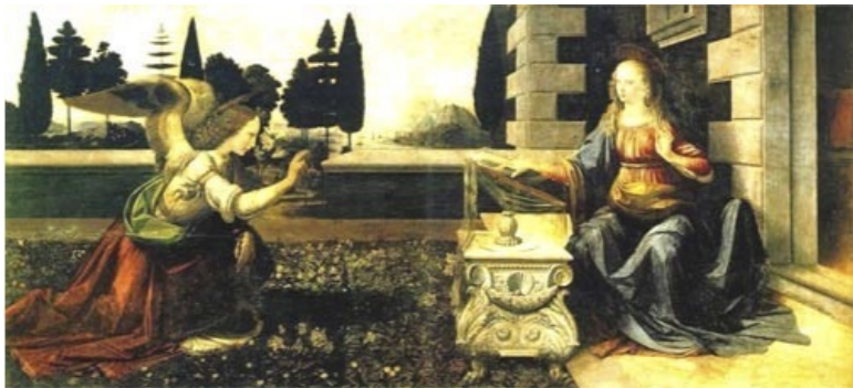
Леонардо да Винчи. Благовещение.

Одновременно это было исполнением всех обетований, которые давал Бог иудейскому народу, так как воплотился Богочеловек среди евреев и именно он был Священным Помазанником, Мессией и новым царем Израиля, но царем «не от мира сего». (Напомним, что сами слова «мессия» и «христос» означают «помазанник»). Даже на свет он должен был появиться в роду, который вел своё происхождение от самого царя Давида. Зачатие Христа было чудом, так как его мать – дева Мария так и осталась девственницей. Весть о том, что она будет матерью воплощенного Бога, зачатого по действию Духа Святого, Марии, жене престарелого плотника Иосифа, передал посланник Бога– архангел Гавриил.