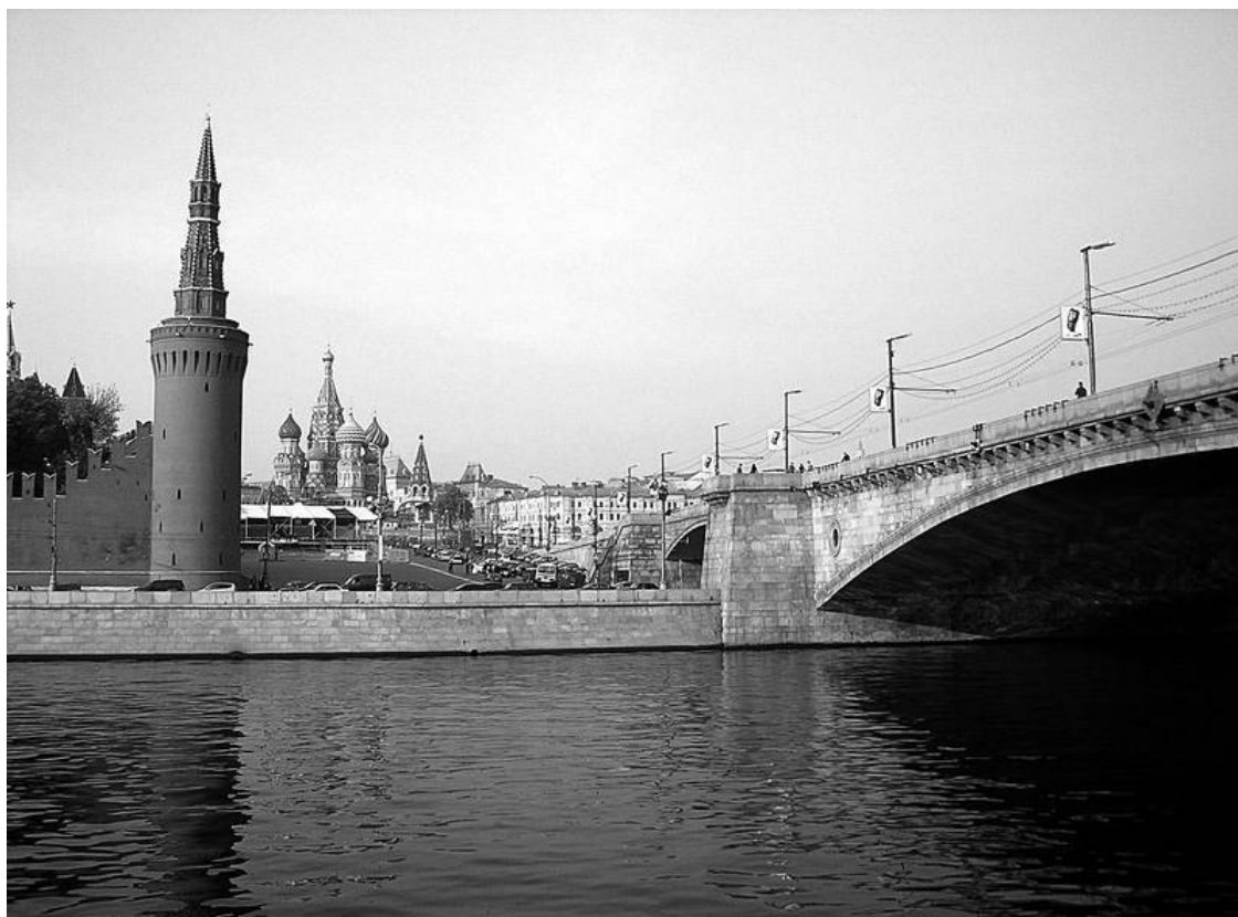
Москворецкий мост, ведущий на Красную площадь

Особая страница в градостроительстве и в мостостроении – 30-е гг. Москвы советской. Сегодня этот период часто рисуют только одной черной краской, но самые впечатляющие мосты-красавцы – от Крымского и Большого Каменного до Устьинского и Большого Москворецкого построены в 1937–1938 гг.