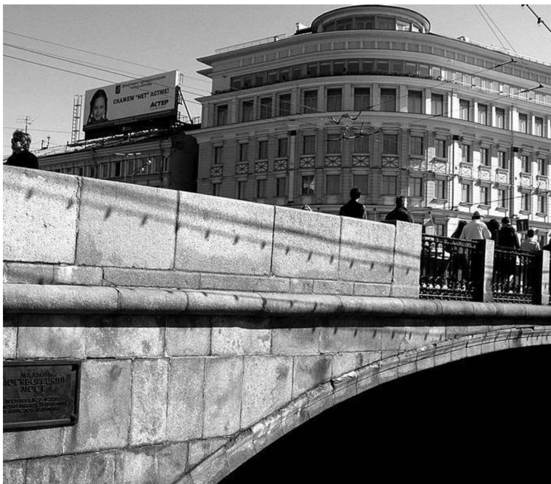
Малый Москворецкий мост