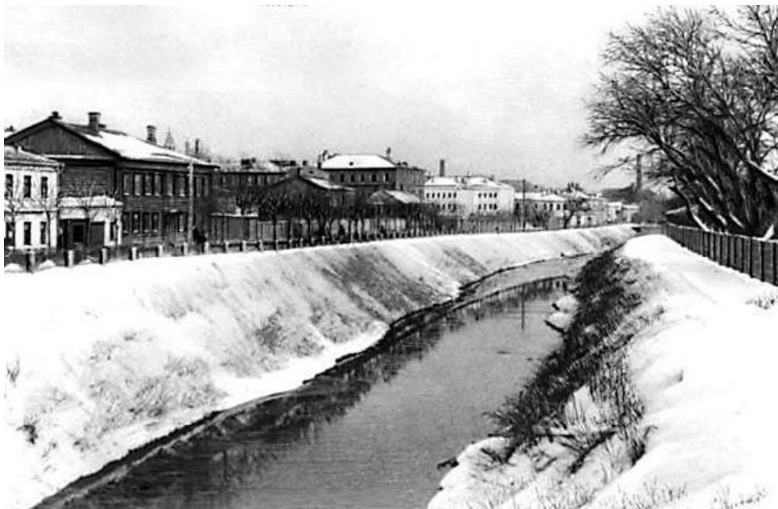
Яуза в конце XIX века

Ну что ж, поверим научным изысканиям, из которых мне ближе всего пермский вариант: основа – моск с довольно широким спектром значений: «ключ, родник, источник, поток, приток». Или балтийский – мазгаз – «узел», поскольку Москва не только причудливо вьется, распадаясь на клубки рукавов и пойменных озер (взгляните хотя бы на Ногатинскую пойму), но и является узлом водных дорог. Во всяком случае, я соглашаюсь с неумными исследователями, которые отвергают с ходу толкование: топкое, болотистое место. Как можно главную артерию Страны источников, красавицу-реку с обрывистыми и холмистыми берегами, со строевыми борами на них, с чистейшей водой и изобилием рыбы сравнивать с болотом? А вот приток, узел – похоже: ведь Москва и сама является притоком и принимает множество других притоков.