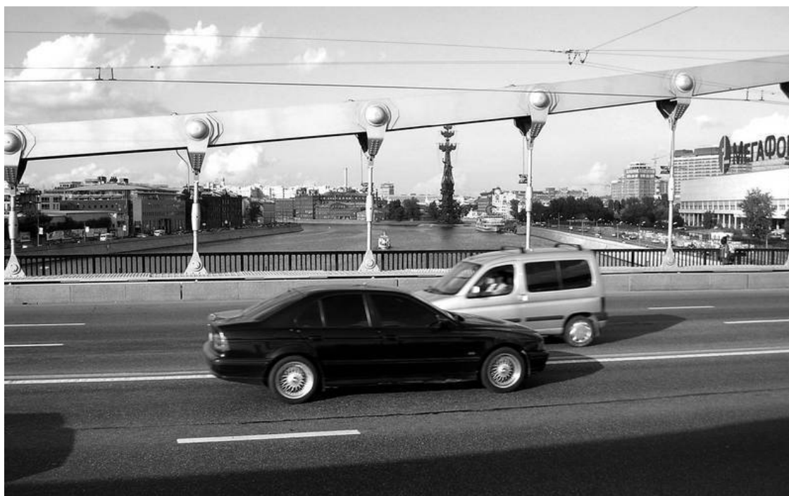
На Крымском мосту

С моста открывается вид на Стрелку с гигантским Петром Зураба Церетели, на Дом художника и Парк искусств, где собраны снятые памятники Москвы.