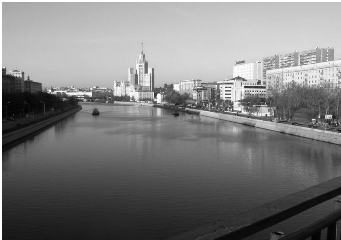
Вид на Котельническую набережную с Устьинского моста

История его такова: построен он был 1940 г. на месте бывшего Яузского моста. А название свое получил в честь Иллариона Астахова – 19-летнего паренька, участника Февральской демонстрации 1917 г., который был застрелен на этом мосту полицейскими.