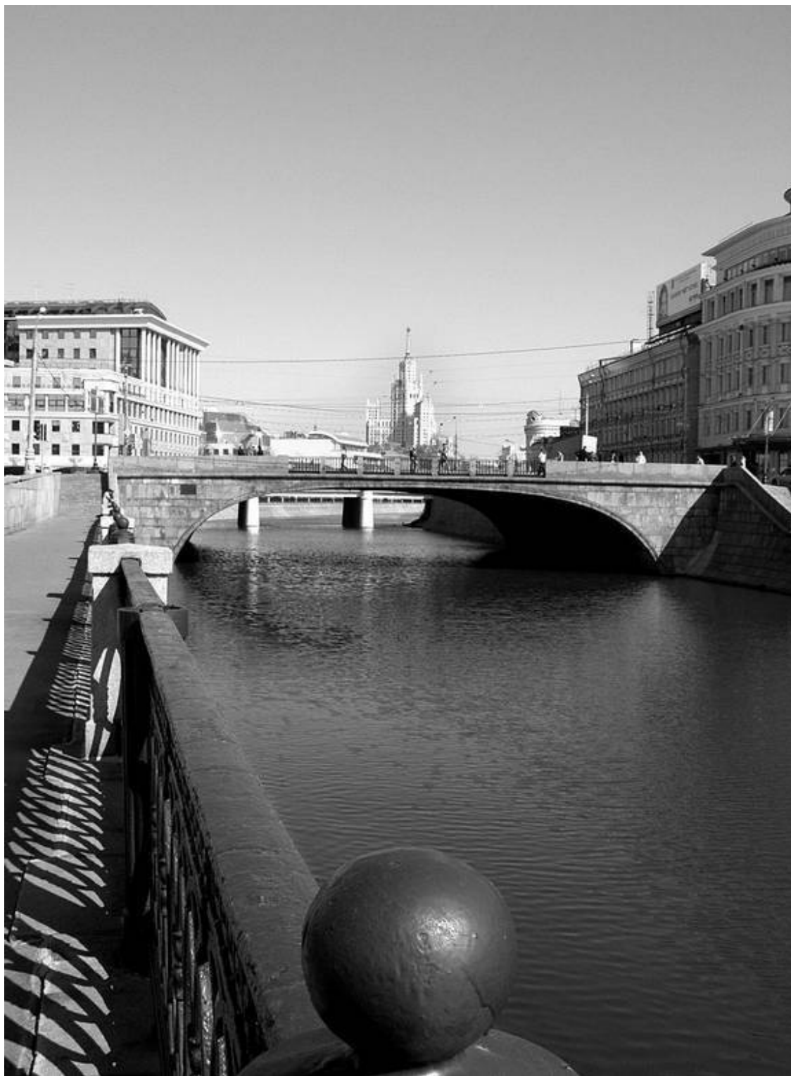
Обводной канал с Чугунного моста

Пешеходный мост через Водоотводный канал в Москве. Расположен между Чугунным и Комиссариатским мостами. Назван по историческим Садовническим слободам XVI–XVII вв. (см. Садовническая наб.).