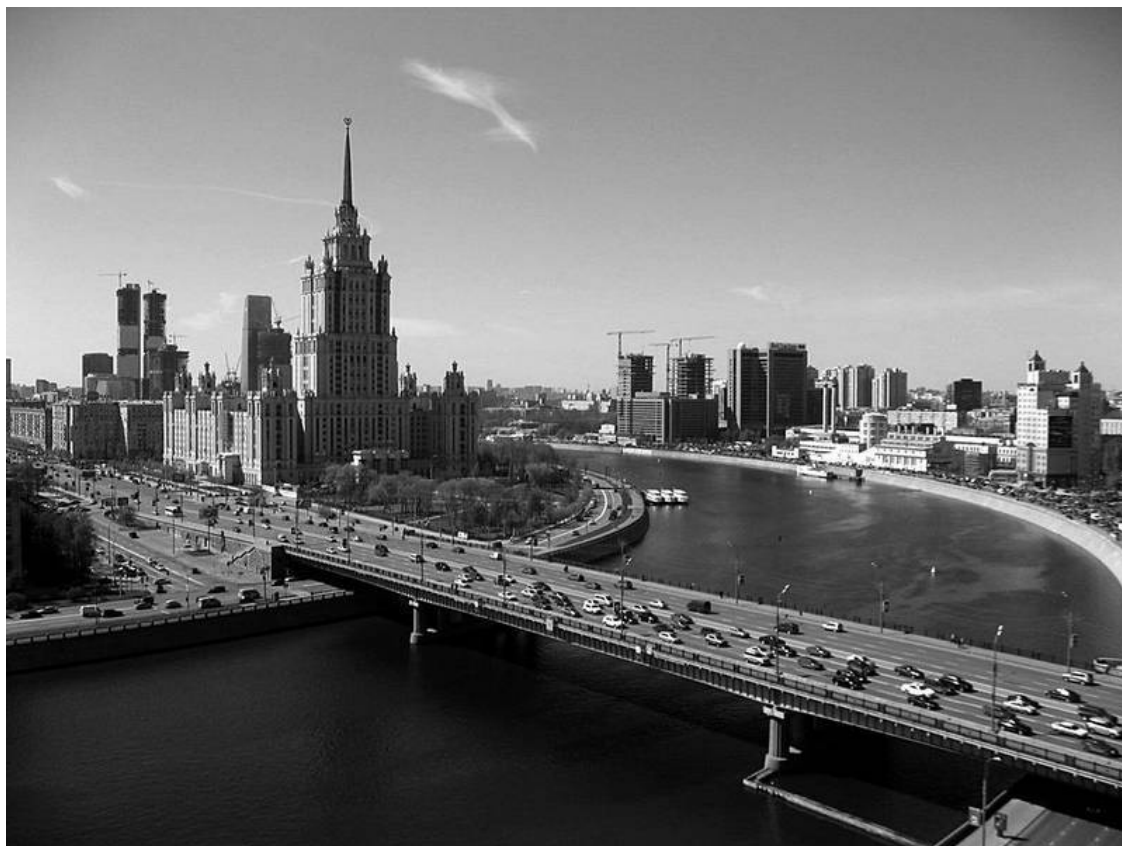
Вид с Бородинского моста на Смоленскую набережную