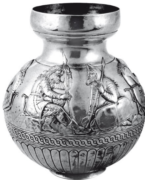
Ваза с изображением скифских воинов. IV век до н. э. Электрум, чеканка

Как видим, большинство обрядов трипольцев и их сородичей носило ярко выраженную сексуальную окраску. Но это не было спецификой одних лишь пеласгов. Сходные ритуалы «магии плодородия» отмечены почти во всех древних обществах. Они отобразились в знаменитой эротической росписи и скульптуре индийских храмов. Обряды «священной свадьбы» существовали когда-то и у германцев, у славян, оставили многочисленные следы в мифологии, представлены на наскальных рисунках Скандинавии.