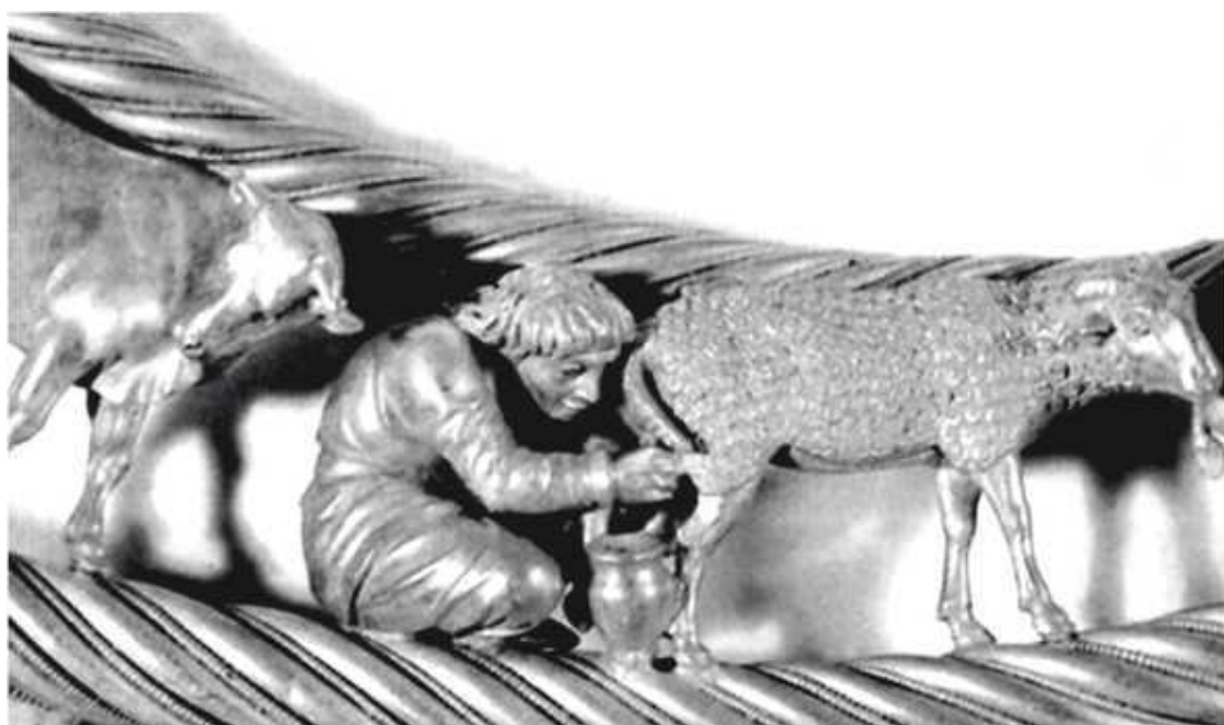
Скифский пектораль, Никополь, 1971 г.