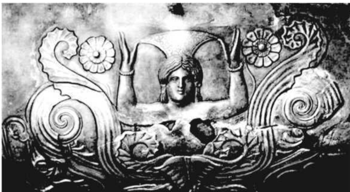
Скифская богиня любви Аргимпаса. Изображение на вазе из кургана Чертомлык. Никопольский район

Быт трипольцев был тесно связан с их верованиями. Весь сельскохозяйственный год неразрывно сочетался с мифологическими представлениями и религиозными празднествами. В древности у всех народов подобные праздники являлись отнюдь не механическим «отмечанием» определенных дат календаря – это были магические ритуалы, производимые в некоторых точках годового цикла, чтобы поддерживать природные условия в благоприятном режиме. Время ритуалов вычислялось жрецами по положению небесных светил. А целью было «единение» с богами через копирование тех или иных их действий, отраженных в легендах. Считалось, что повторение из года в год выработанных обрядов должно «привязать» земной цикл к «небесному», обеспечить повторяемость и неизменность климатических факторов.