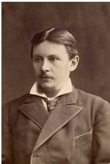
Фото Ю. Ю. Клевер

Юлий Юльевич Клевер (1850—1924) – российский художник немецкого происхождения. Получил признание как пейзажист салонно-академического толка. Академик Императорской Академии Художеств (1878), классный художник первой степени (1876), профессор (1881).