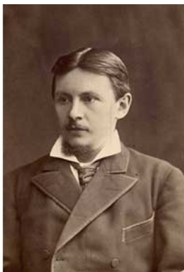
Фото Ю. Ю. Клевер

Юлий Юльевич Клевер (1850—1924) – российский художник немецкого происхождения. Получил признание как пейзажист салонно-академического толка. Академик Императорской Академии Художеств (1878), классный художник первой степени (1876), профессор (1881).