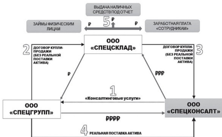
Рис. 3. Пример вывода активов из юридического лица, сопряженного с незаконным обналичиванием денежных средств

ным противоправным деяниям, ввиду отсутствия необходимости трансформации иных активов (зданий, сооружений и т. д.) в денежные средства 40 . Собственник помимо переведенных активов на баланс другого юридического лица, например, транспортных средств, получает также незаконно обналиченные денежные средства. Нередко вывод активов осуществляется с оказанием фиктивных услуг (рис. 3).