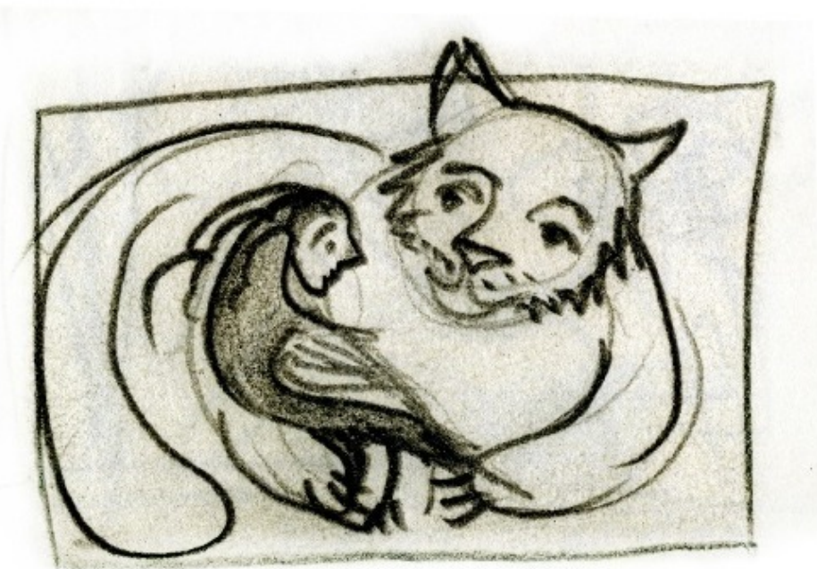
Это мы – Кот и Птиц (Прим. автора)

Не судите строго эти 104 страницы про любовь. Пусть они сделают вас чище и прекраснее, пусть они подарят вам надежду, что счастье достижимо, если ты искренне стремишься к нему!