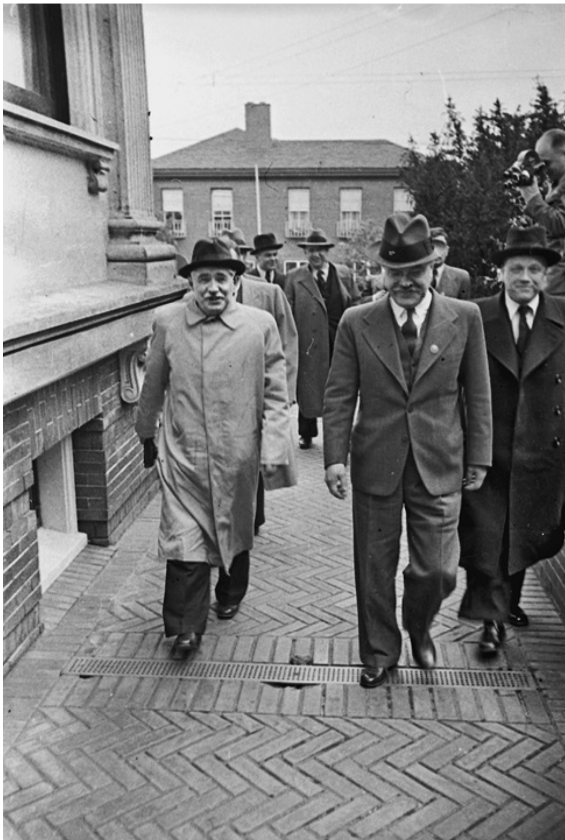
Ил. 5. Вячеслав Молотов (в центре) в Сан-Франциско. Весна 1945 года.

2 мая Красная армия захватила рейсхканцелярию, последний оплот нацистского руководства. Защитники Берлина капитулировали. Советские солдаты рыскали по улицам города