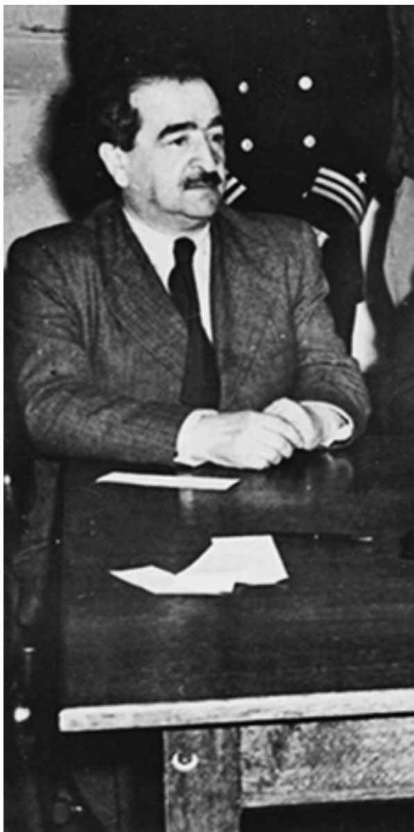
Ил. 4. Арон Трайнин. 1945 год.

Алексей Толстой и восьмидесятилетний бывший председатель Верховного суда Чарльз Эванс Хьюз. Эта комиссия должна была распространять информацию о немецких зверствах и отчитываться перед союзными правительствами 53 .