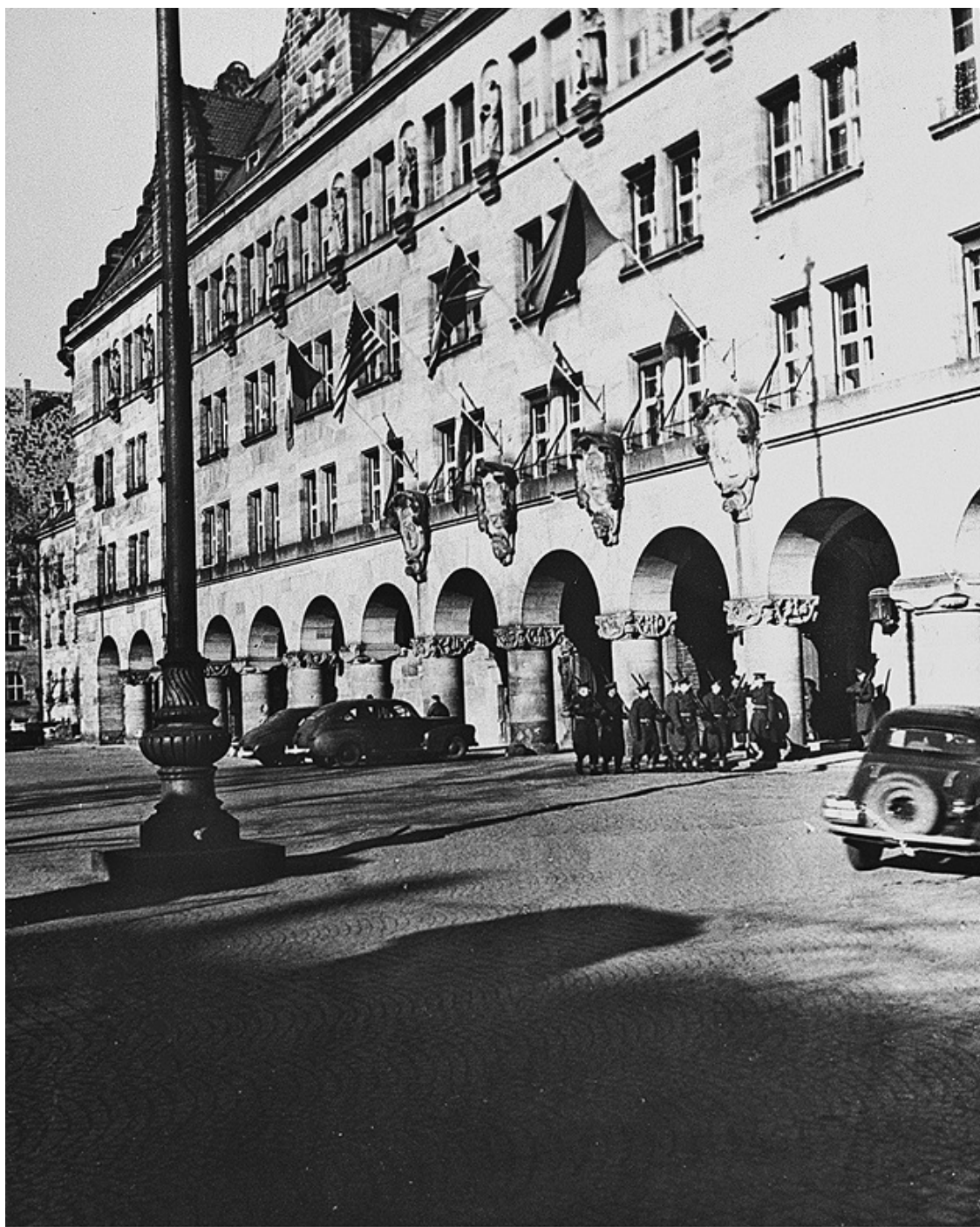
Ил. 1. Дворец юстиции в Нюрнберге, место проведения Международного военного трибунала. 1945–1946 годы.

Оставив багаж в пресс-лагере, расположенном к юго-западу от города, Кармен направился прямо в суд. Он спешил. Из-за плохой погоды задержался его рейс в Нюрнберг. Было уже 22 ноября: он пропустил первые два дня процесса и не хотел больше терять времени. Его машина свернула на Фюртерштрассе, одну из немногих улиц, сохранивших свой вид. Там за коваными железными воротами стоял Дворец юстиции. Четырехэтажное здание начала XX века выглядело сравнительно не тронутым войной. Тысячи немецких военнопленных были подражены американскими оккупационными войсками заделывать дыры от пуль и ремонтиро-