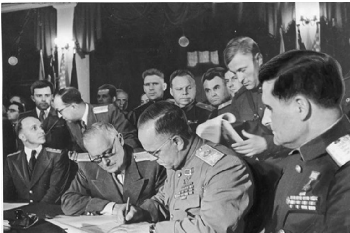
Ил. 3. В. Д. Соколовский (справа) и А. Я. Вышинский (слева) присутствуют при подписании Г. К. Жуковым акта о капитуляции Германии. 8 мая 1945 года.

Сталин восхищался беспощадностью Вышинского и в 1928 году сделал его судьей в первом большом советском показательном процессе. Пятьдесят три инженера из города Шахты в Ростовской области были обвинены в участии в преступной организации, которая якобы занималась в сговоре с иностранцами саботажем в советской угольной промышленности. Шесть недель Вышинский председательствовал в суде в московском Доме Союзов. Его холодная логика впечатляла иностранных журналистов и прочих наблюдателей. Все обвиняемые, кроме четырех, были осуждены; пятеро казнены 39 . Через два года Вышинский председательствовал в суде над Промпартией. Восемь видных экономистов и ученых были обвинены в сговоре с Францией с целью свержения советского правительства; все были осуждены. Вскоре Сталин назначил Вышинского заместителем прокурора СССР и заместителем наркома юстиции РСФСР 40 .