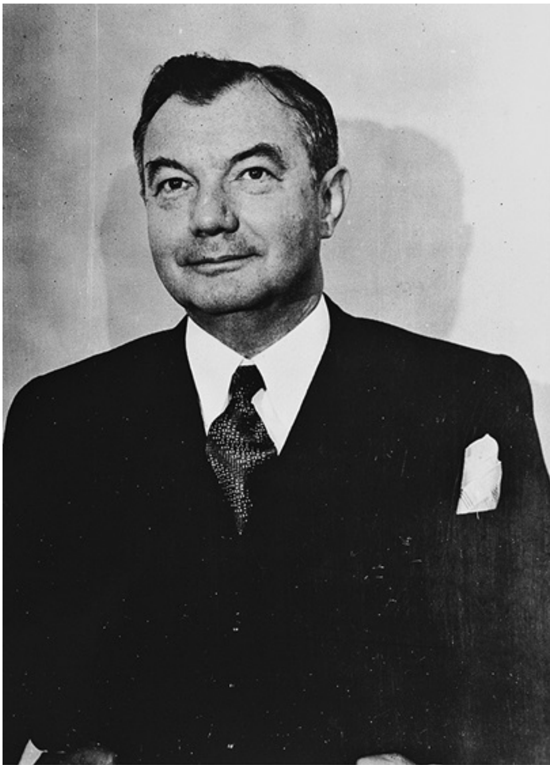
Ил. 6. Роберт Х. Джексон. 1945 год.

Тем же вечером Джексон поговорил по телефону с Розенманом, который сопровождал Рузвельта в Ялте. Тот заверил, что касательно репараций все пункты соглашения были сформулированы «крайне расплывчато» 154 . (Разумеется, эти слова полностью противоречили тому, что он внушал Молотову днем ранее.) Но 6 мая Джексон получил от Бернейса другой сек-