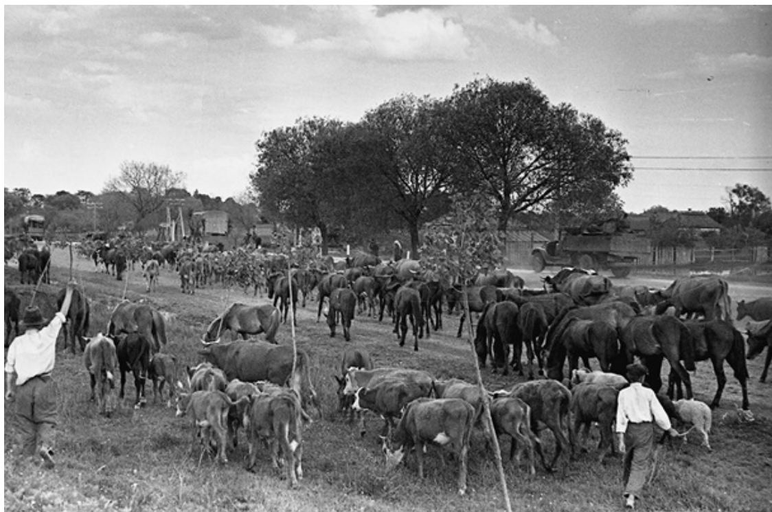
Ил. 2. Эвакуация скота из прифронтовой зоны. 1941 год.