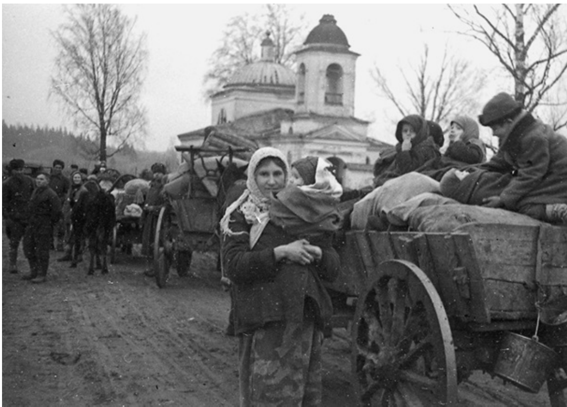
Ил. 1. Эвакуация людей из прифронтовой зоны.

Ситуацию усугубляла загруженность дорог. Навстречу поездам, отправленным в тыл, тянулись бесконечные эшелоны на фронт, в результате чего возникали заторы и огромные очереди.