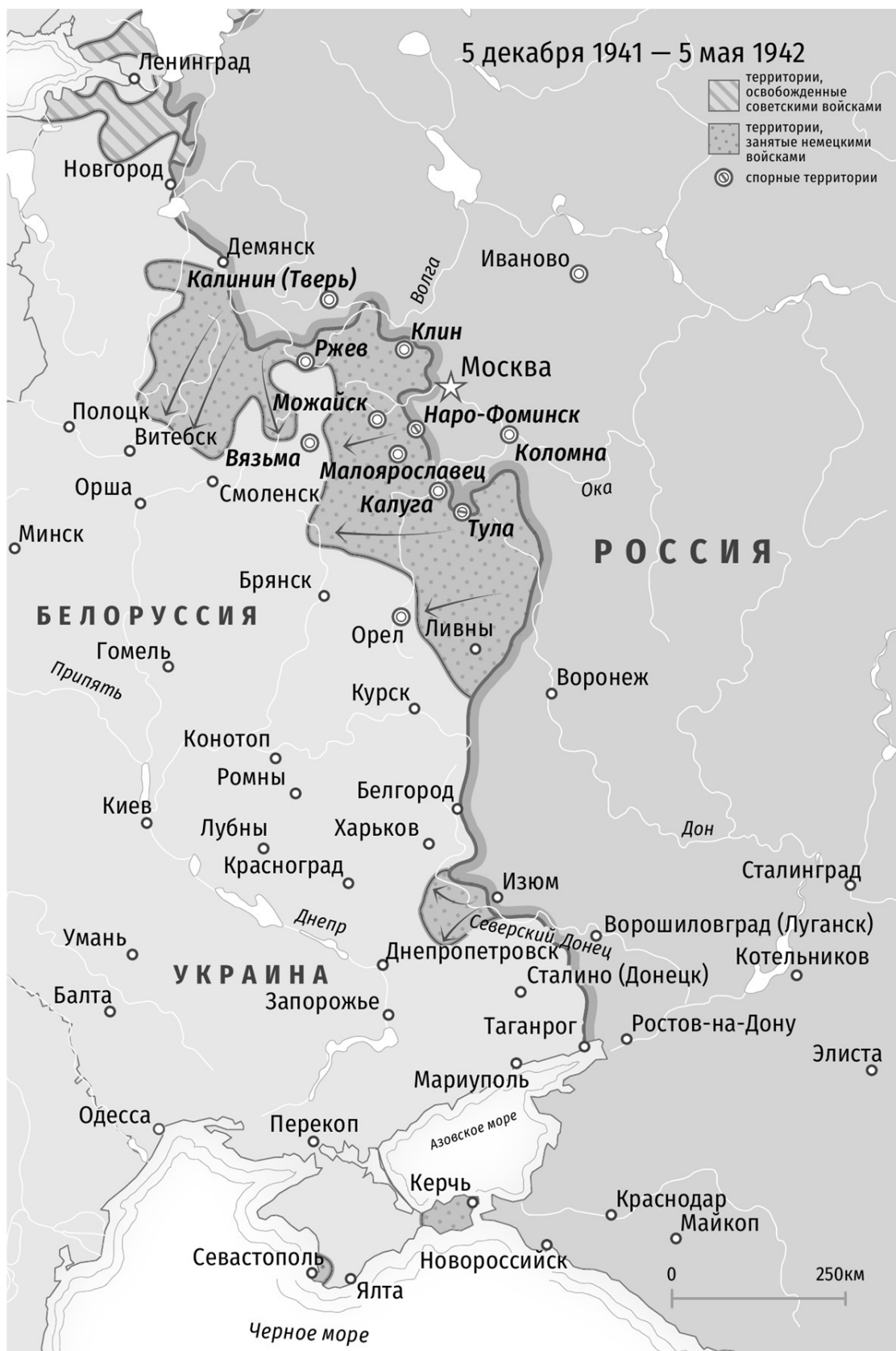
Карта 3. Линия фронта. 5 декабря 1941 года – 5 мая 1942 года