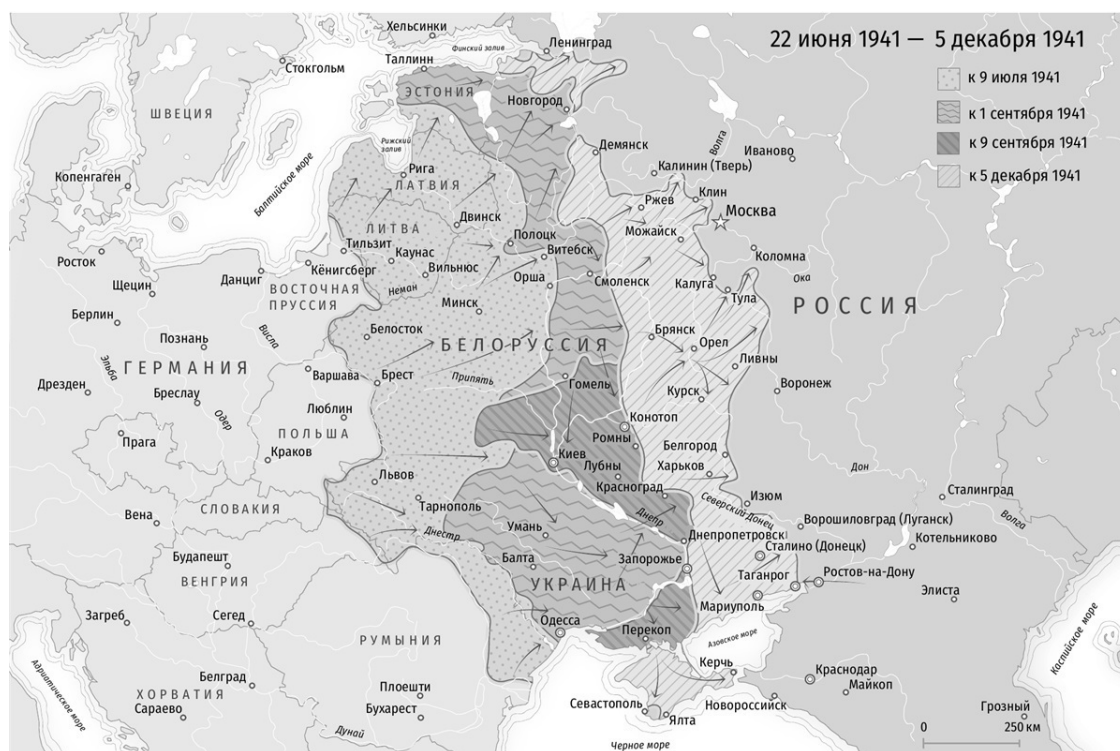
Карта 2. Линия фронта. 22 июня – 5 декабря 1941 года