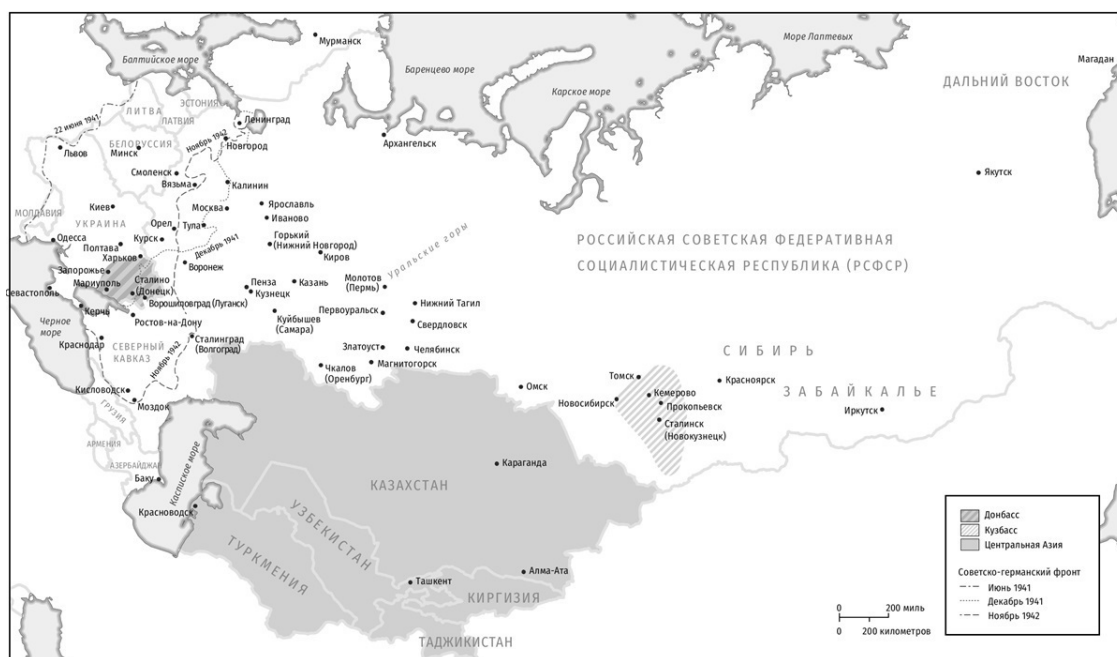
Карта 1. Советский Союз, 1941–1945. Линия фронта в июне 1941 года – ноябре 1942 года

Ворошиловград (Луганск) Горький (Нижний Новгород) Калинин (Тверь) Куйбышев (Самара) Ленинград (Санкт-Петербург) Молотов (Пермь) Молотовск (Северодвинск) Орджоникидзе (Владикавказ) Свердловск (Екатеринбург) Сталинград (Волгоград) Сталино (Донецк) Сталинск (Новокузнецк) Чкалов (Оренбург)