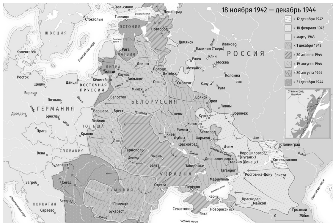
Карта 4. Линия фронта. 18 ноября 1942 года — декабрь 1944 года