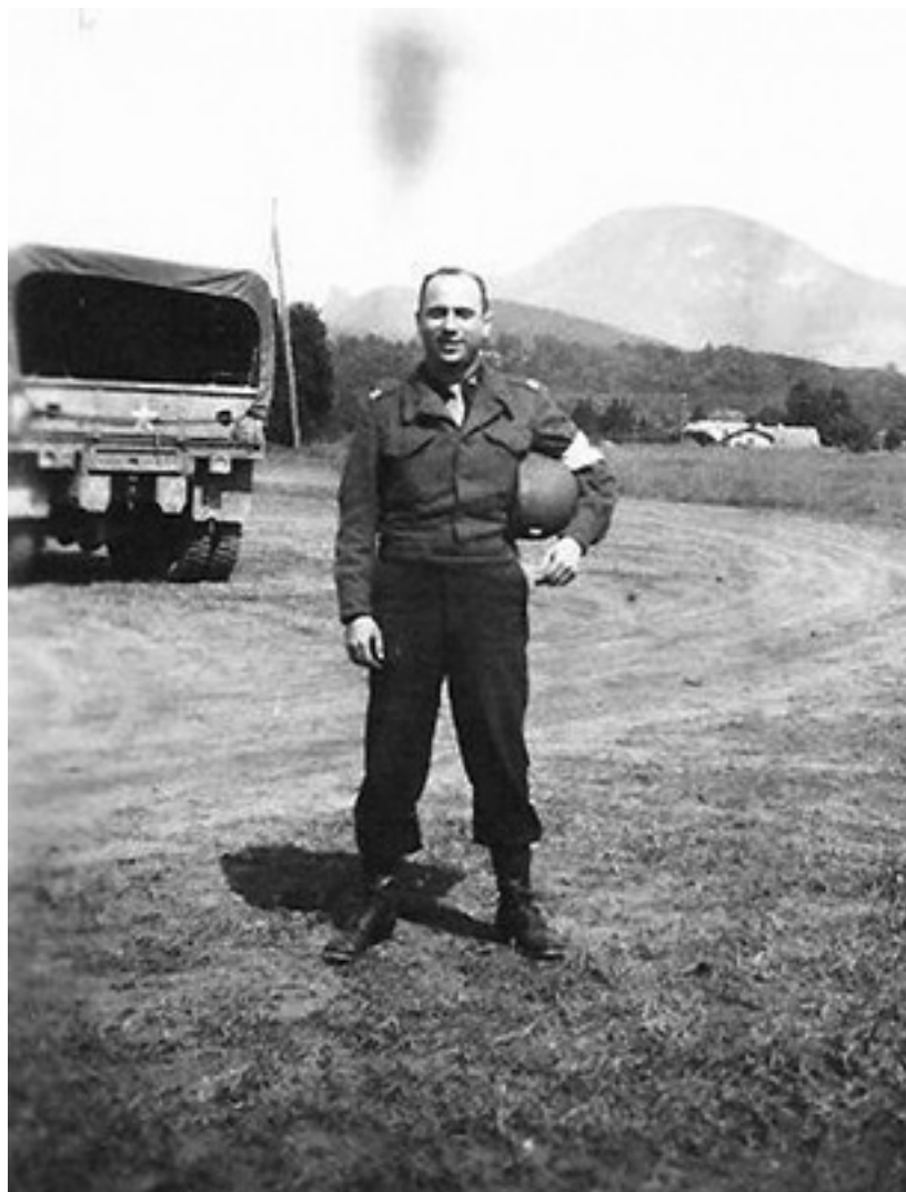
Дэвид Фильцер, военный хирург, лечивший бывших узников нацистских концлагерей.