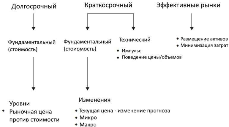
Рис. 1.1. Подходы к инвестированию

Есть большой класс инвесторов, которые явно не являются стоимостными. Речь идет о «технических» аналитиках. Они избегают фундаментального анализа любого рода, им не интересны ни направление деятельности компании, ни ее баланс или отчет о прибылях и убытках, ни характер ее товарных рынков, ни что-либо иное, важное для фундаментального инвестора любой масти. Экономическая ценность им неинтересна. Вместо этого они обращают внимание на данные торговых операций, то есть на колебания курса и объемы продаж ценной бумаги. По их мнению, динамика курса, на которую влияют изменение спроса и предложения ценной бумаги, отражает некие закономерности. Анализируя их, можно делать выводы о будущем движении це-