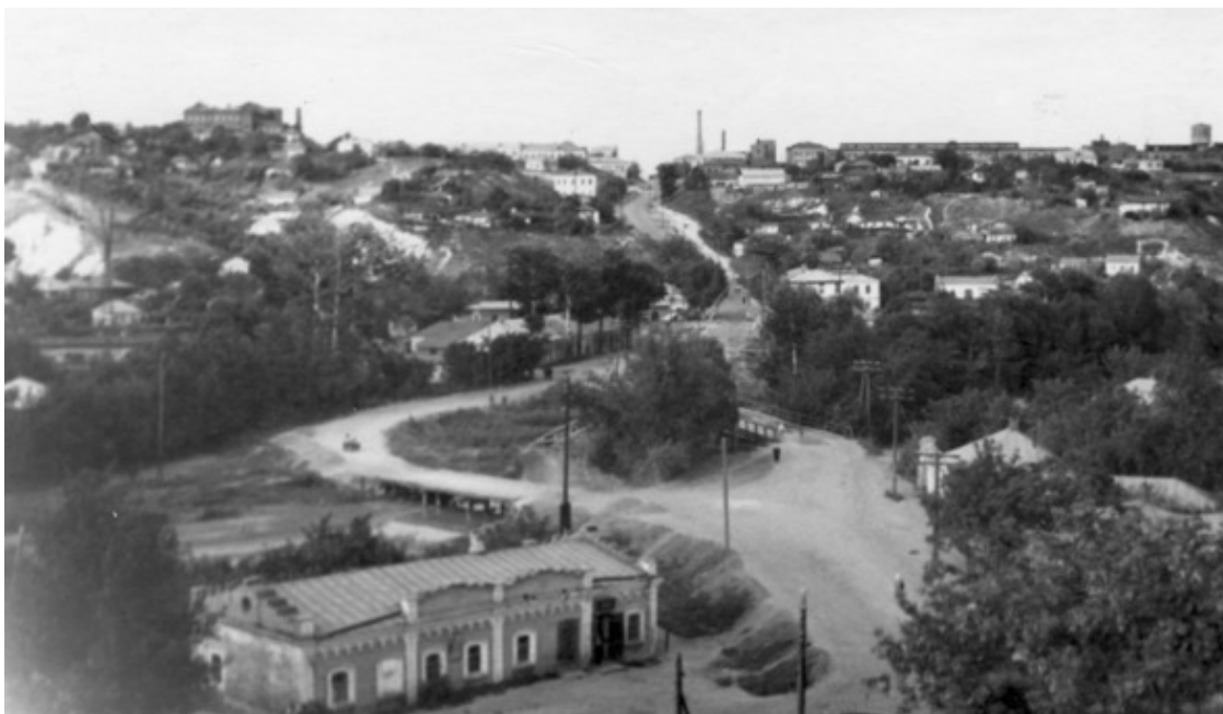
Старый Оскол, сороковые годы 20 века.