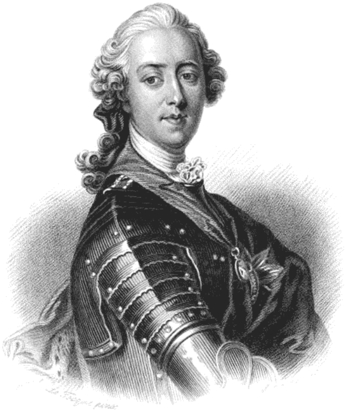
Рис. 5. Карл Эдуард Стюарт, он же Молодой Претендент.

Сторонников у Стюартов было много, особенно на наци-