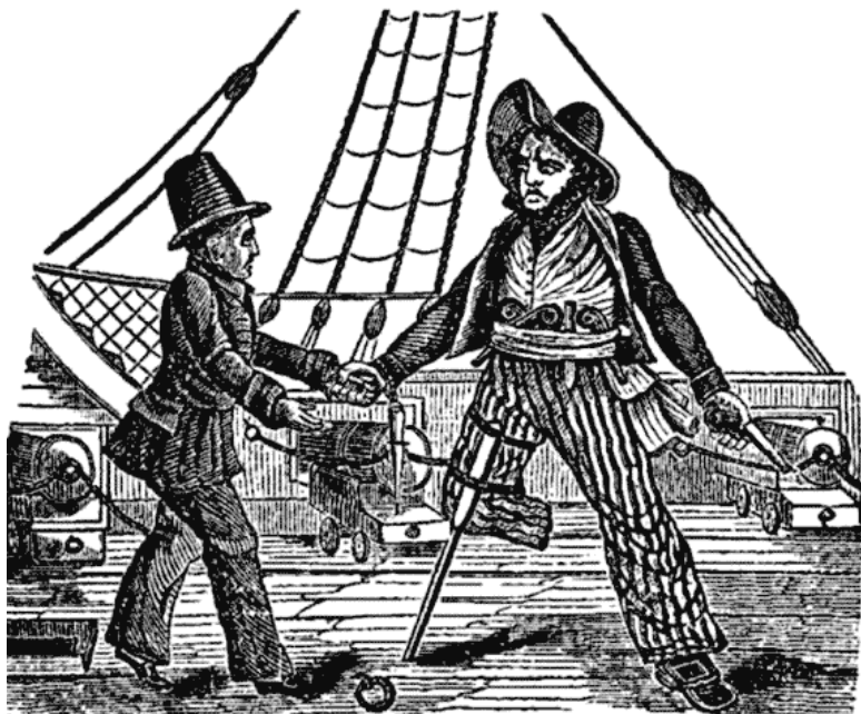
Рис. 2. Единственный прижизненный портрет Джона

Эти цифры куда более правдоподобны. Ингленд начал пиратствовать в 1717 году, Сильверу двадцать один год, он взрослый мужчина, вполне способный отличиться при абордажах и заработать за два года немалый авторитет.