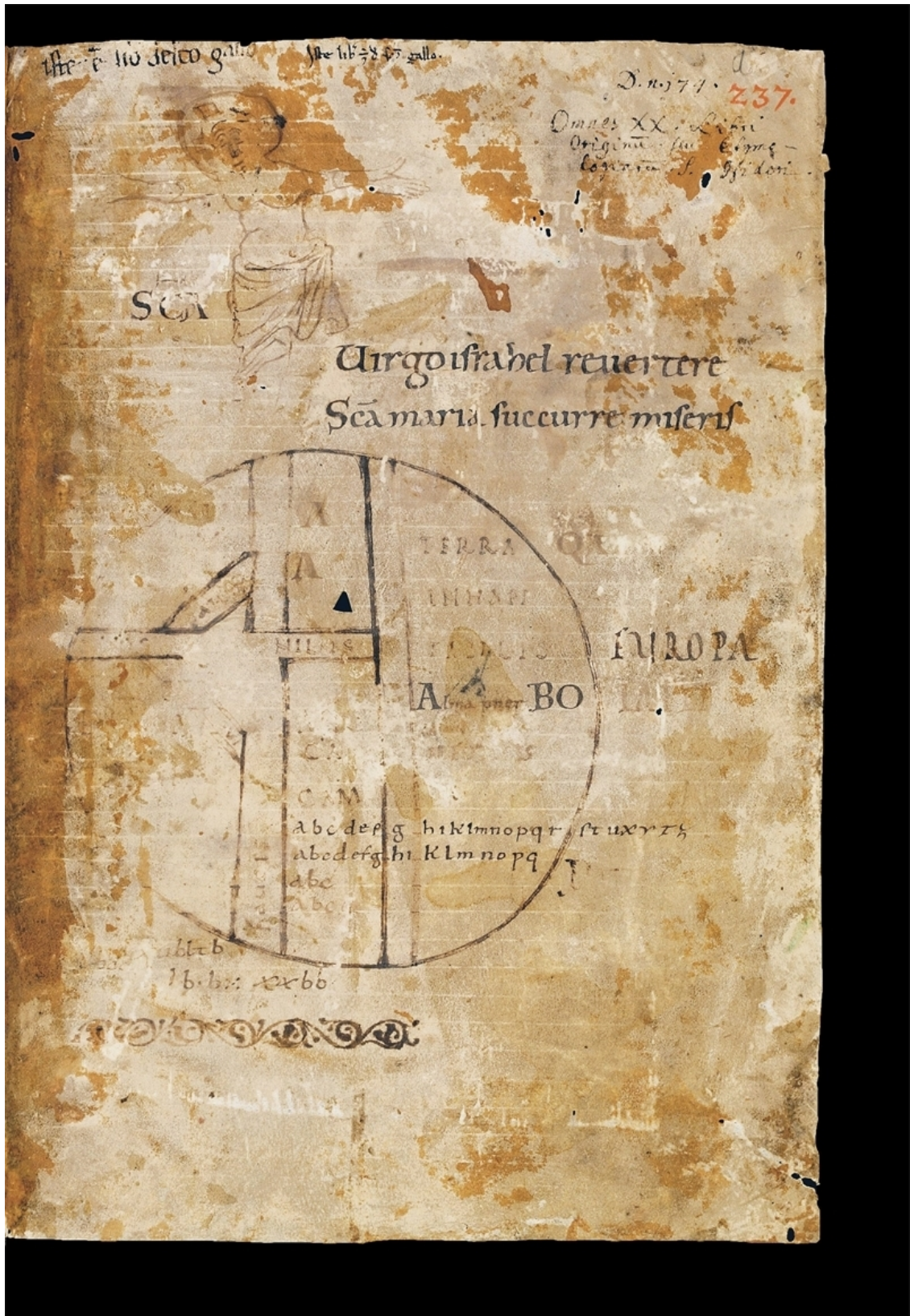
С. 15 Самая старая из сохранившихся карт эпохи Средневековья была нарисована в конце VII или начале VIII века. В ее верхней части мы видим Иисуса, возвышающегося над земным шаром с распростертыми руками. Африка подписана именем Хама, Ноева сына, кото-

выслушивала бесконечные истории о картах разной степени увлекательности и позволяла мне писать и вычитывала главы.