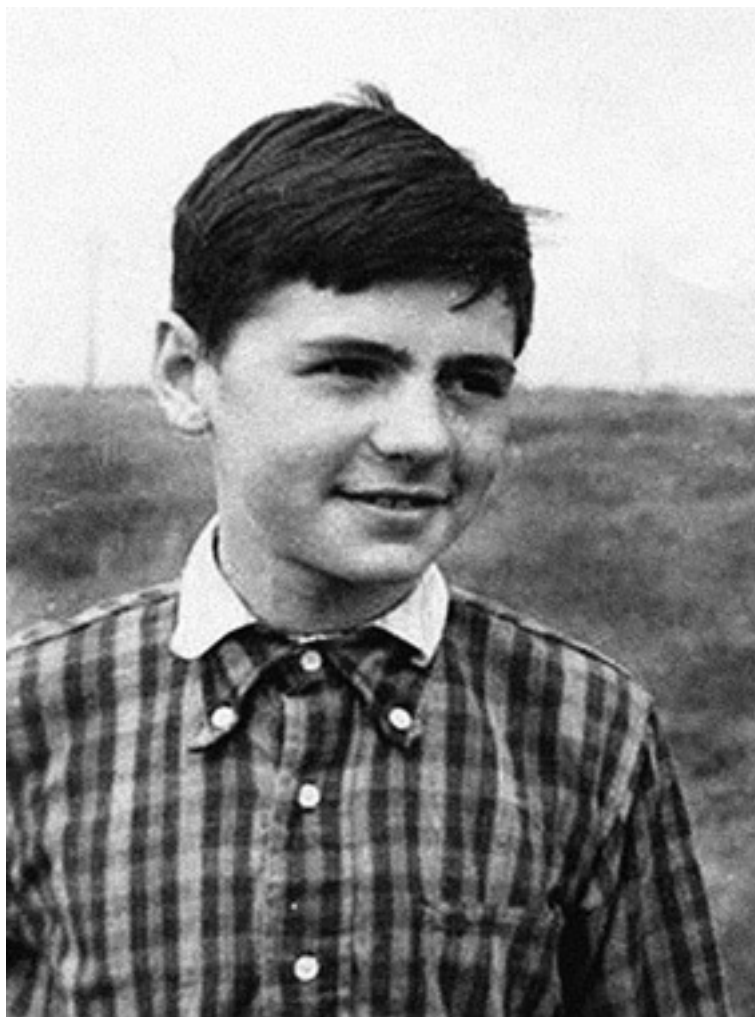
Андрей Зализняк, 1948 год

Весной муж мой приехал туда, когда началась навигация, когда можно было доехать; он приехал и увез нас оттуда к себе. За эту зиму их уже переселили, стекольный завод вывезли в Мончаж.