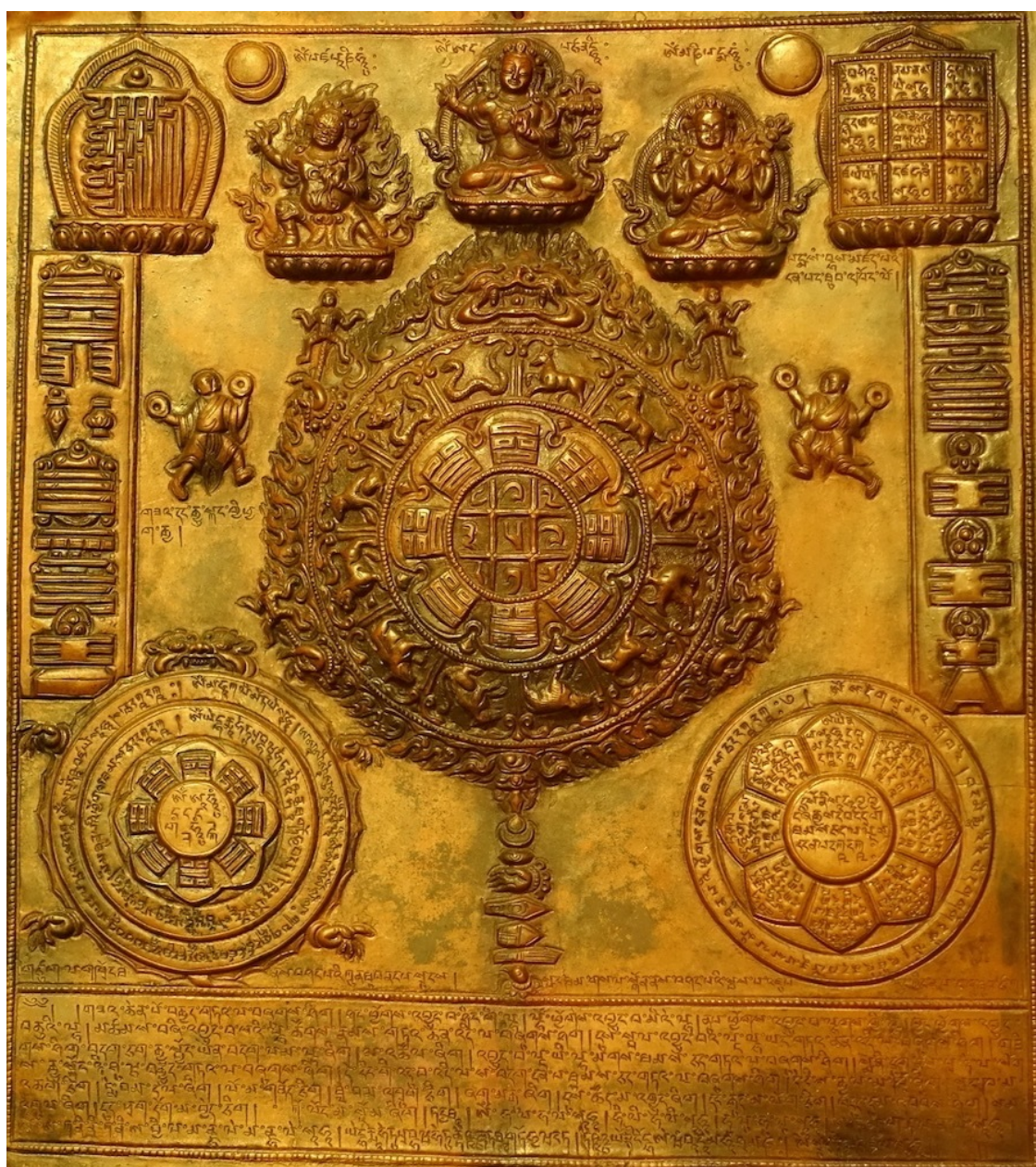
Тибетская астрологическая танка, XIX век

В тибетской астрологии в качестве символов 12-летнего цикла выбраны 12 Животных: Мышь (Крыса), Бык, Тигр, Заяц, Дракон, Змея, Лошадь, Овца, Обезьяна, Петух, Собака и Свинья. В различных восточных астрологических традициях перечень Животных может меняться, но в тибетской астрологии он именно такой и определён в соответствии с легендой о Будде, который перед уходом в паринирвану призвал Животных, чтобы благословить их. Пришли 12 Животных и именно в том порядке, в котором они теперь сменяют друг друга в 12-летнем цикле.